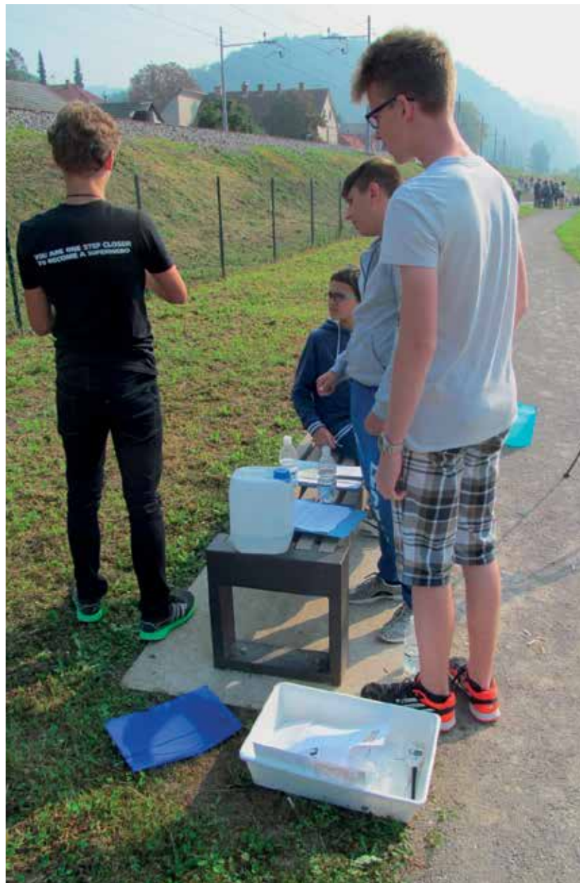
Slika 4: Terensko delo z raziskovanjem vode in postavitvijo oznake za visoke vode je potekalo na OŠ Sava Kladnika v Sevnici.

Zato je najbolje opraviti takšne terenske naloge, ki so obvladljive, rezultati pa interpretativni in nazorni. Čeprav je v šoli celo zaželeno, da se ugotovljeni rezultati učencev kdaj razlikujejo od pričakovanih, predvidljivih ali napovedanih, se je v načrtovanju terenskega dela smiselno držati t. i. šolskih, enoznačnih primerov. Smiselno je tudi izbrati takšne meritve in raziskave, ki jih je možno vpeti v vzročno-posledični splet in učence s tem navajati na celostno razmišljanje, pri katerem spoznajo, kaj je vzrok, kaj posledica, kaj morebitni povod oz. sprožil, kaj dejavnik in kaj