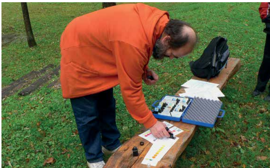
Slika 1: Pouk ob vodi. Ob nekem vodotoku je možno opraviti vrsto poskusov in meritev. Na sliki določanje nitratov, nitritov in pH s pomočjo reagentov in indikatorskih lističev.

Keywords: water, lesson, curriculum, school, fieldwork