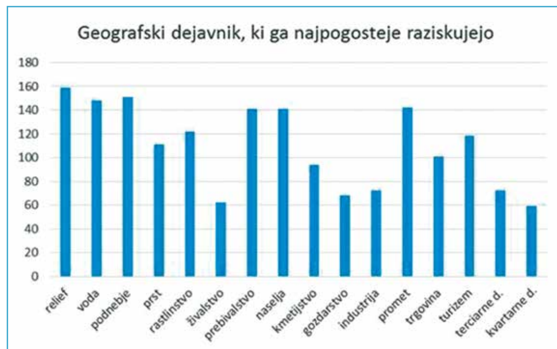
Slika 2: Pogostost raziskovanja geografskega dejavnika s terenskim delom

Čeprav je marsikatera lega šole idealna za terensko raziskovanje, se večina učiteljev med poukom ne odloča zanj. Vzroki so po anketi učiteljev geografije (Lipovšek, 2016): naporna priprava, strah pred neuspelo izvedbo,