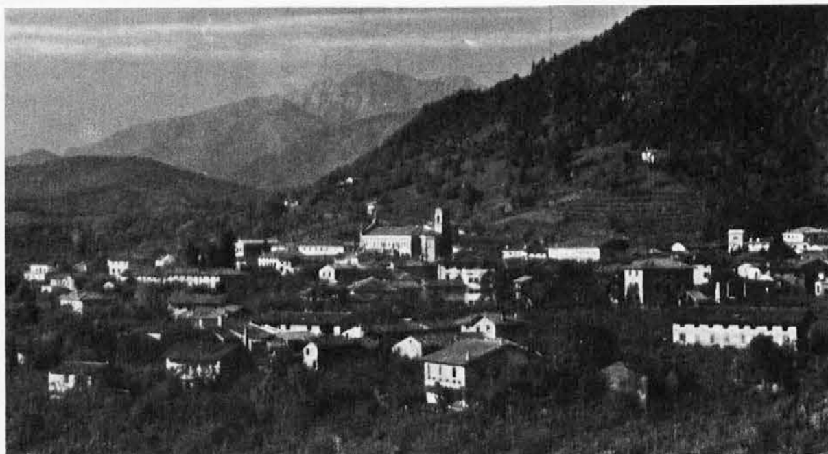
FOJDA, ena najlepših in največjih vasi vinorodnega področja v Beneški Sloveniji

IZ ČEDADA: 6,20 - 7,20 - 8,20 - 9,20 - 10,20 - 11,20 - 12,20 - 13,20 - 14,20 - 16,20 - 17,20 - 18,20 - 19,40 - 20,40.