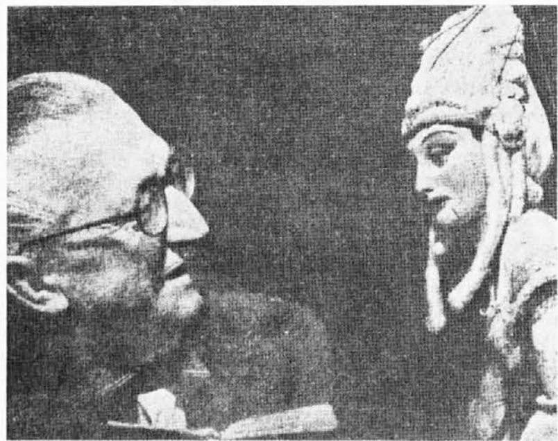
VITTORIO PODRECCA, oče svetovno znanih lutk

Čedadski komunski svet je pred nedavnim sklenil, da poimenuje eno izmed ulic po očetu lutk Vittoriju Podrecci iz Čedada, sinu slavnih Podrekov iz Beneške Slovenije.