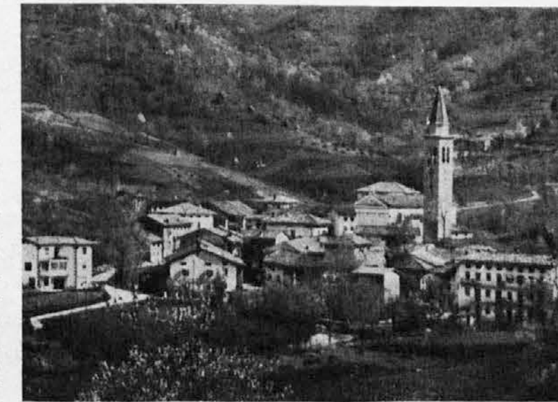
PLATIŠČE, privlačna turistična točka, ker tu izvira Nadiža

Bistvo reforme naše univerze mora biti predvsem v globoki spremembi same miselnosti (in torej tudi strukture) akademskih oblasti. Svojo besedo pri tem morajo končno povedati predvsem študentje, znanstveni raziskovalci in prizadeto prebivalstvo. Pri tem pa je treba odpraviti vso šovinistično in lokalpatriotsko navlako v vodstvu univerze, ki bi morala zaživeti v mednarodnem okviru, upoštevajoč tudi potrebe aktivnega soživanja tu živčih in sosednjih narodov in narodnosti. Šele takšna univerza bo zares univerza v najboljšem pomenu te besede in njeno poslanstvo bo le tako učinkovito, plodno in tudi bogato.