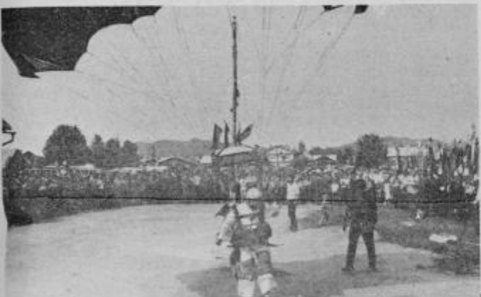
Osrednjo sklepno slovesnost so v Moškanjcih pričeli padalci ptujskega Aerokluba, ki so doskočili pred postrojene gasilce ob tamkajšnjem gasilskem domu.

Izvršni svet skupščine občine Ormož je podrobneje obravnaval poročila o izvajanju melioracij in komasacij in ugotovil, da je plan usposabljanja in urejanja zemljišč v srednjeročnem obdobju 1981—85 dosežen, čeprav Geodetski zavod Maribor nekoliko kasni z deli. Naročili so, da mora