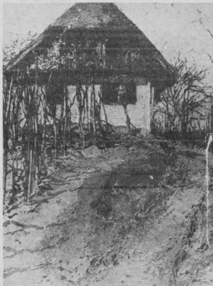
Luigi Kasimir: Domačija v Halozah, barvna radiranka, okrog 1930. Na Haloze so Luigija Kasimira vezali najlepši spomini. To je dokazal tudi v predstavljeni grafiki. Kmečka hišica je oblita s toplo sončno svetlobo, prijazna pot se mehko ovija okrog domačije in pred temnim ostrešjem se je nežno rožnato razcvetela breskev. Grafiko v dveh primerkih hrani Pokrajinski muzej Ptuj, eden (z inv. šte. G 510 g) je razstavljen v grajski galeriji. Fototeka kulturnozgodovinskega oddelka PMP šte. F 1753.