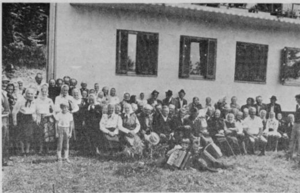
Udeleženci srečanja v Juršincih, skupaj s predstavniki KS