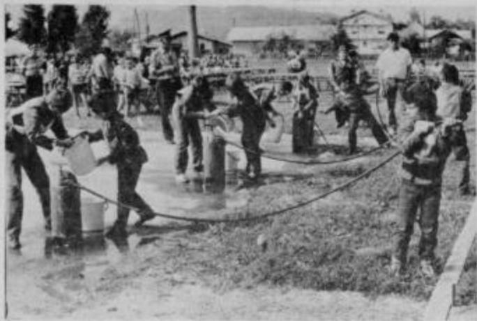
S sobotnega tekmovanja pionirjev ob GD Moškanjci