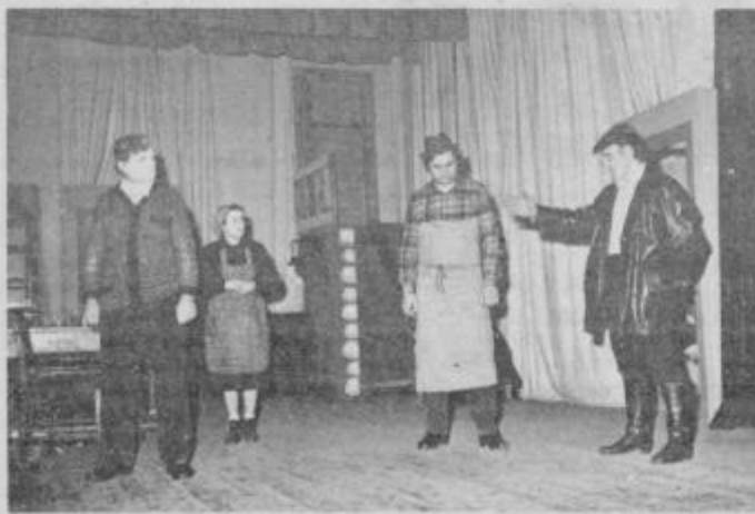
Z enega uspešnih nastopov dramske skupine PD Grajena z dramo Krefli.