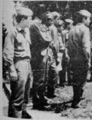
Pripadniki ptujske enote so se ob prazniku poklonili spomenu narodnega heroja Dušana Kvedra-Tomaža, po katerem nosi vojašnica tudi ime.

V ponedeljek, 15. julija, so v vojašnici Dušana Kvedra v Ptuj proslavili dan enote. Že dopoldne so vojakom in starešinam pri-