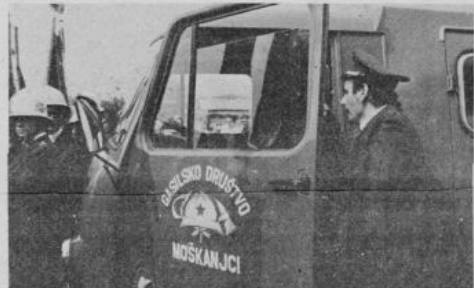
Gasilci iz Moškanje so ponosni na dograjen in prenovljen gasilski dom, še posebej pa na nov gasilski kombi, ki so ga ob 80-letnici predali namestu.