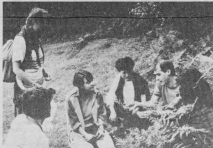
Botanična skupina pri delu

Na vseh področjih so bili prisotni mentorji, profesorji posameznih strok, ki so delo in raziskave vodili. Mladi raziskovalci so ob takšnem delu spoznali kraj ter kulturno dediščino in se seznanili z zgodovino in kulturnimi spomeniki iz NOB. Rezultate so obdelali računalniško, tako so se udeleženci seznanili z možnostjo uporabe računalnikov pri vrednotenju podatkov. Svoje končne rezultate so predstavili javnosti na razstavi ob zaključku tabora, napisali pa so jih tudi v obliki strokovnih poročil, katera bodo združeno dostavljena ob-