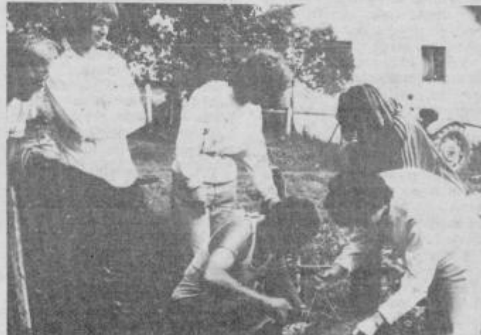
Zoologi ob proučevanju vodnih živali

činski raziskovalni skupnosti, ki je tabor sofinancirala in bodo primerna za načrtovanje dolgoročnejših raziskav na tem področju in izdajo ustrezne publikacije.