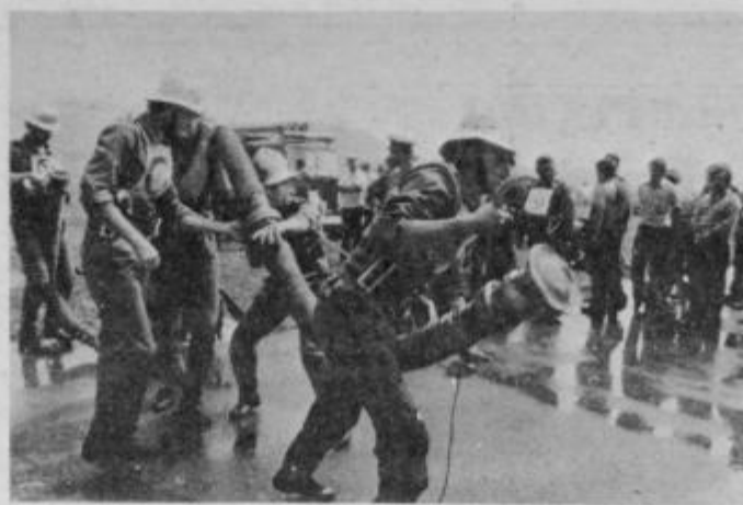
Razburljivo je bilo tudi nedeljsko tekmovanje mladincev, članov in članic ter posebnih gasilskih enot