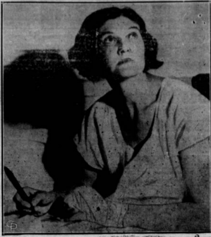
Winnie Ruth Judd je v Phoenixu, Arizona; razkosala dve ženski, s katerimi je prišla v prepir vsled ljubosumnosti ali karkoli je že bil glavni motiv, in ju poslala v kovčegu v Los Angeles. Zločina so prišli na sled in morilko prijeli. Ona je iz dobre ameriške familije. Njen oče je duhovnik in njen mož zdravnik. Ameriški bizniški tisk je posvetil temu zločinu ogromno prostora. Poročali so tudi, da bo Juddova napisala knjigo o svojem življenju. Na tej sliki jo vidite, kako so jo časniki fotografirali pripravili v pozu, kakor da knjigo že piše. Če jo kak izarlatan res izda v njenem imenu ter s njenim dovoljenjem, bo seveda vsled "reklame" dobila veliko cirkulacijo, ki bo prinesla lep profit založniku in nji obilen "honorar". — Umor je umor, pravijo eni. Pa ni. Način, katerega se je poslužila Winnie Judd, je "zanimiv", čeprav ne posebno originalen. Neki rojak v Chicagu, ki je nedavno ubil prijatelja ter ga oropal, pa je storil svoje dejanje s kladivom za nabijanje vinskih sodov. Svoji žrtvi je najprvo stolkal glavo in mu nato odvzel denar. Zelo zelo primitivno, in zato se čikaški listi izven slovenskih in enega čezkega niso skoro nič brigali za ta roparski umor. Winnie pa bo napisala knjigo in pri tem zaslužila denar vsled svojega zločina, ako se med tem seveda kaj ne dogodi, kar bo prekržalo račune.

V svojem govoru je Foster stresel toliko fraz, s katerimi je "črnil" soc. stranko ter o. nanjal svoj evangelij, da se človek čudi, kako more taka oseba sploh biti kje voditelj. Seveda, opozicionalce, kot so bili Lovestone, Gitlow, Canon in mnogo drugih komunističnih vodij, je izključil, okrog sebe pa je dal "porotnike", kateri mu igrajo teater.