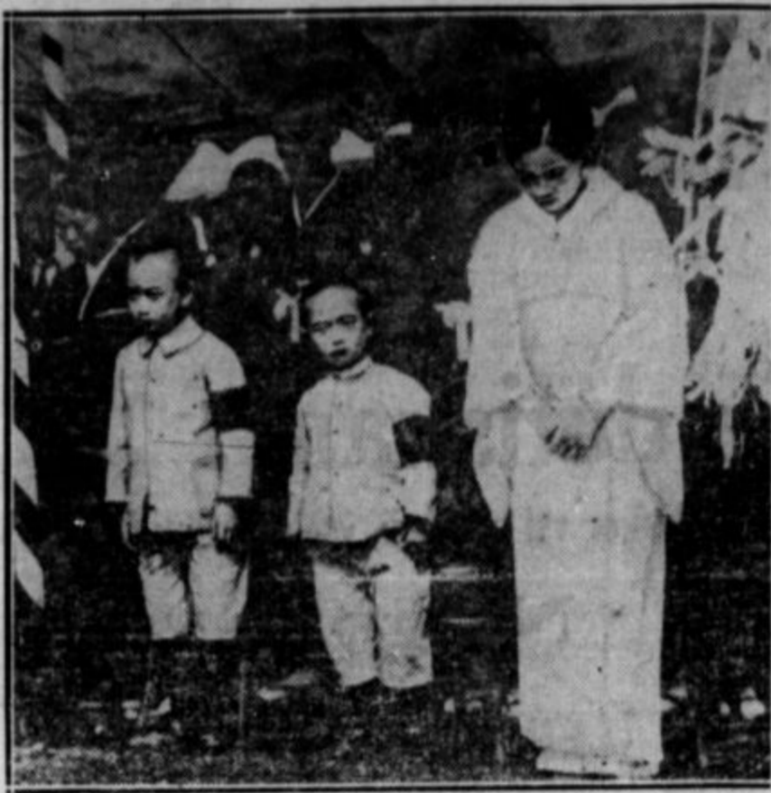
Na daljnem vzhodu je nenapovedana vojna. Japonci pobijajo Kitajce in tudi Kitajci ubijajo kakega japonskega vojaka, kjer se jim ponudi prilika. Za te padle japonske "junake" je bil v prošlem mesecu proglašen poseben spominski dan, da je ljudstvo molilo za njih, ki so dali življenja "za domovino in cesarja". Na sliki so sorodniki padlega oficirja, ki molijo v templju v Tokiju na spominski svečanosti. (Glej tudi sliko in besedilo na četrti strani.)

gojimo bodisi petje ali dramo zavestno: ne samo radi petja ali igre kot take, ampak ker se zavedamo pomena Ameringerjevih besed: da si mora delavstvo ustvariti lastno kulturo, ki naj ga spremlja v njegovih bojih.