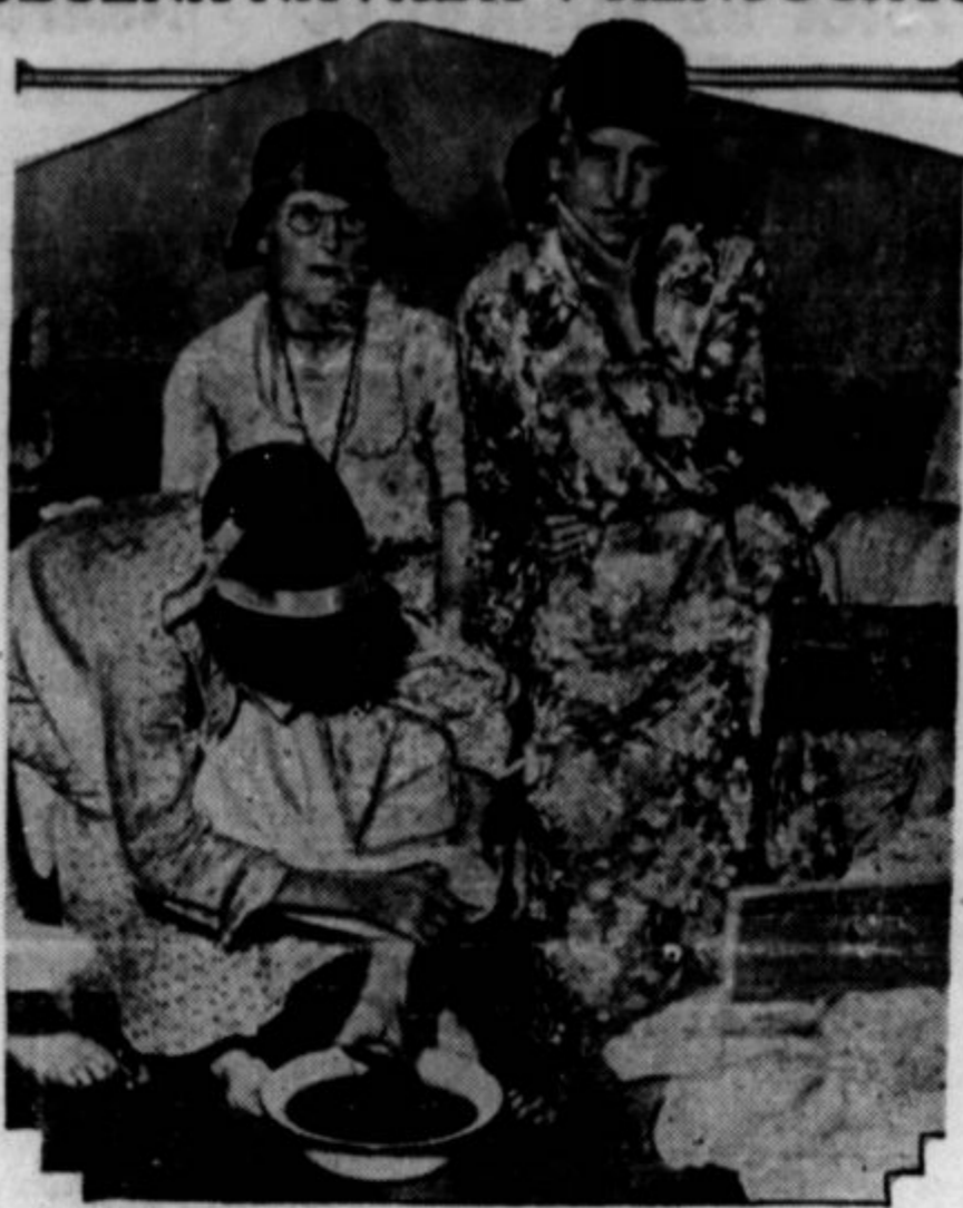
V nekaterih vaseh v Kentuckyju je še vedno ohranjena navada ceremonijalnega umivanja nog. Ker se je Krist ponižal, da je umil noge svojim učencem, čemu se ne bi verniki? In tako se v kentuckyjskih hrikih ljudje abirajo skupaj ter umivajo noge drug drugemu. Ob takih prilikah tudi veliko molijo. Ta slika je bila vzeta v vasi Mayking v Kentuckyju.