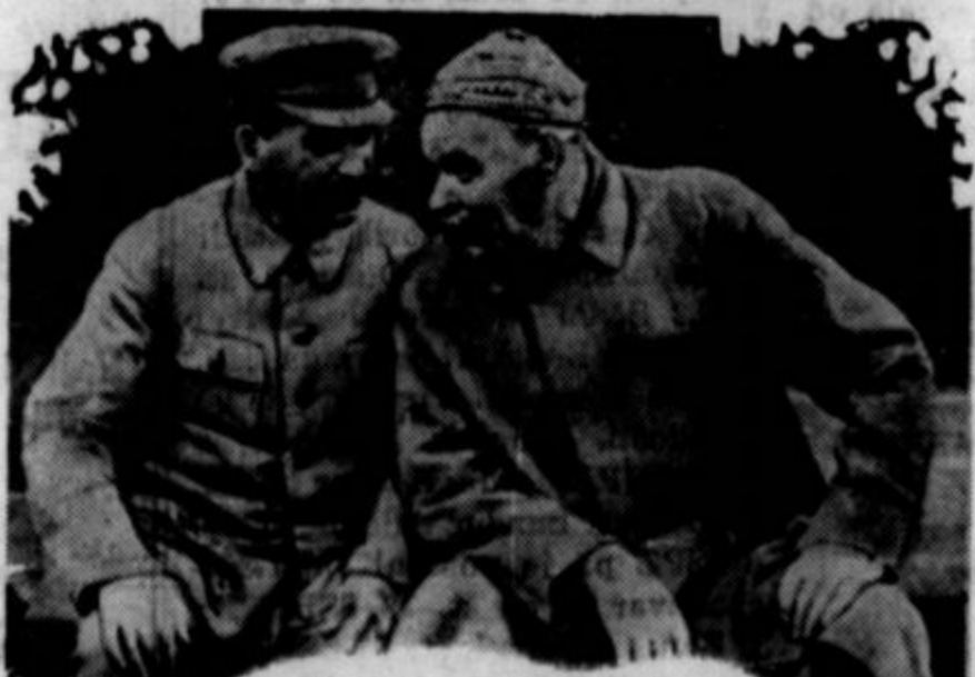
Josep Stalin, sedanji vodilni kremler sovjetske Unije, in slaviti pisatelj Maksim Gorki, sta velika družna prijatelja, kar potrjuje tudi ta slika. Gorkij je živel po revoluciji večinoma v Staliju, toda je sicer navdušen priatelj sovjetskega sistema in njegovih vladov. Od kraja je sicer grajal brutalnosti, ki so v takih revolucijah neizbežne, toda jih je obenem opravičeval s zgodovinskimi dejstvi in razvoja dobil, katero tvorijo danes Unijo sovjetskih socialističnih republik.