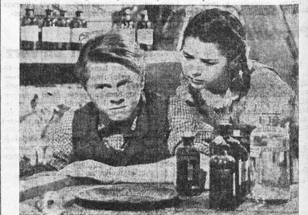
MICKEY ROONEY V FILMU TH. A. EDISONA