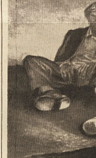
ZIGAINA: Zidarji pri počitku

TOVARNA STROJEV PRI SV. ANDREJU (FMSA) , ki zauzema 85.900 kv m površine,