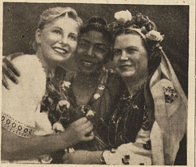
NAJ ŽIVI 8. MAREC — MEDNARODNI PRAZNIK ŽENA