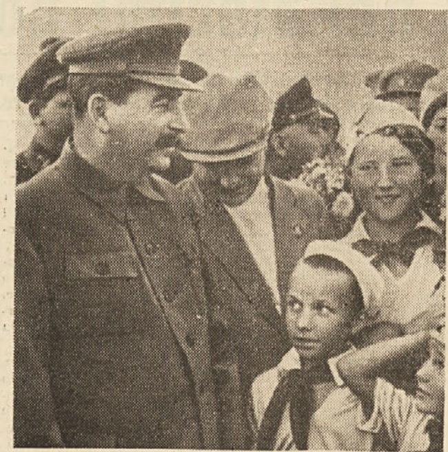
Veliko je bilo veselje sovjetskih pionirjev, ko so se srečali s tov. Stalinom.

in socializmu vedno borili. In v tem letu se je tudi v Jugoslaviji marsikaj vidno spremenilo. Tudi v Jugoslaviji so prišla od izraza vsa notranja nasprotja, v katerih se kopljejo titovski voditelji.