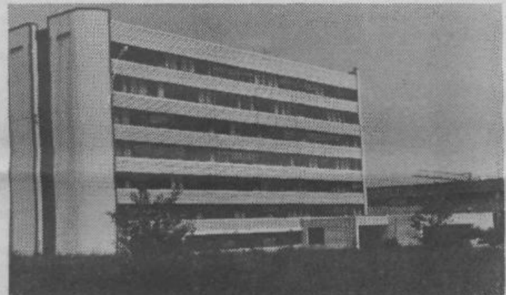
Mogočna stavba v industrijski coni, ki od daleč deluje bolj »hotelško« kot »industrijsko«, preživlja v sebi hudo krizo. Del nje in stavba ob njej so Kovinski obrati. Tekst in slika: S. G.