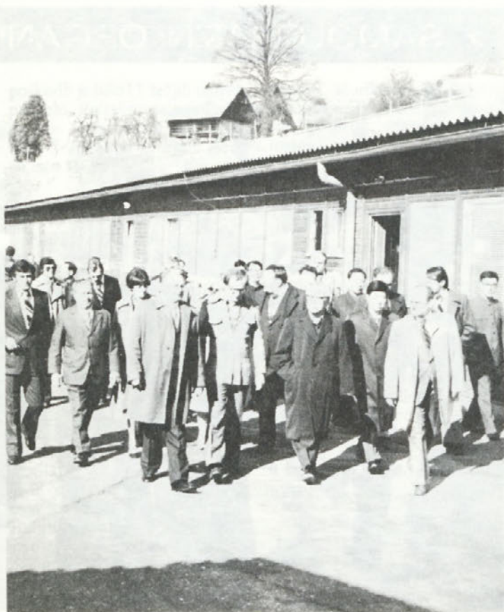
V sredo, 22. marca, je obiskala Industrijo motornih vozil v Novem mestu delegacija KP Kitajske. Med razgovori, ko so sledili ogledu tovarne, so se gostje zanimali predvsem za naše izkušnje pri sodelovanju s tujimi partnerji.