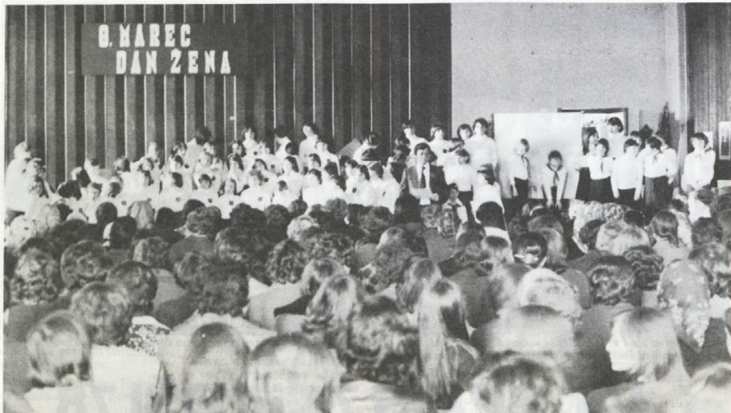
Na proslavi dneva žena je sodeloval tudi pevski zbor učencev in učenk osnovne šole Grm.