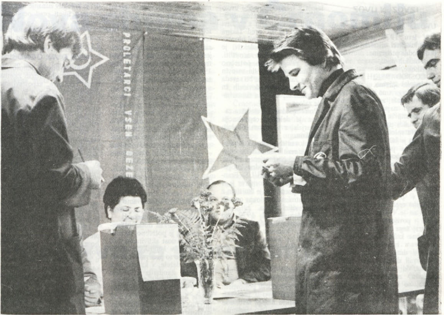
9. marca smo pri nas volili delegate za zbor združenega dela in za skupščine samoupravnih interesnih skupnosti.