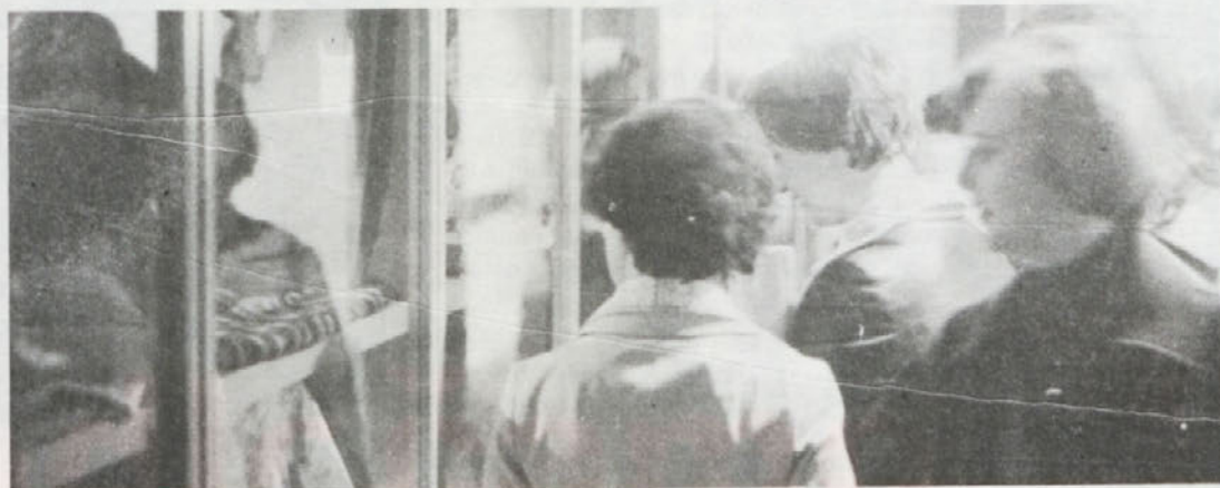
Po končani proslavi so si naše žene ogledale razstavo ročnih izdelkov učenk in učencev osnovne šole Grm.

Samoupravna stanovanjska skupnost občine Novo mesto Odbor za kreditiranje stanovanjske graditve