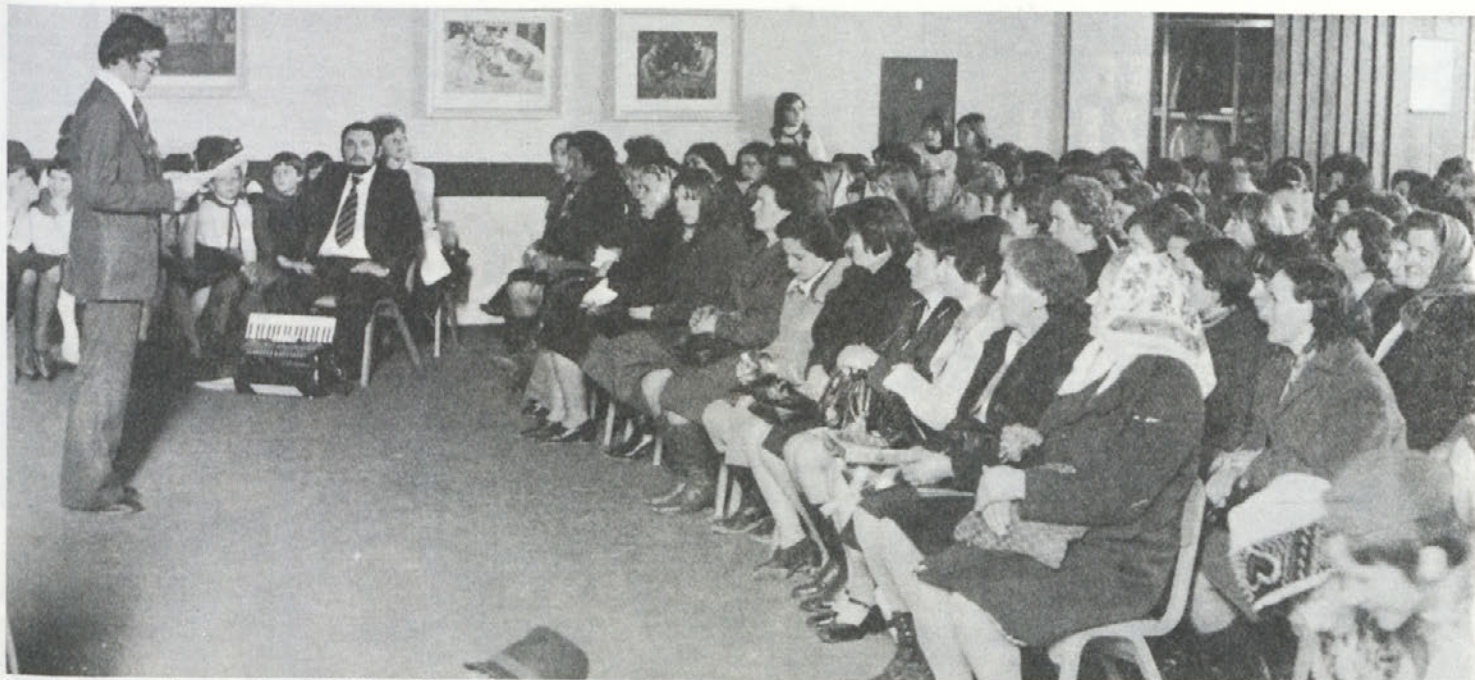
Proslave dneva žena se je udeležila večina žena in mater, ki so zaposlene v IMV. Vse so izredno pozorno sledile kulturnemu programu, ki so ga pripravili učenci osnovne šole GRM pod vodstvom svojih mentorjev.