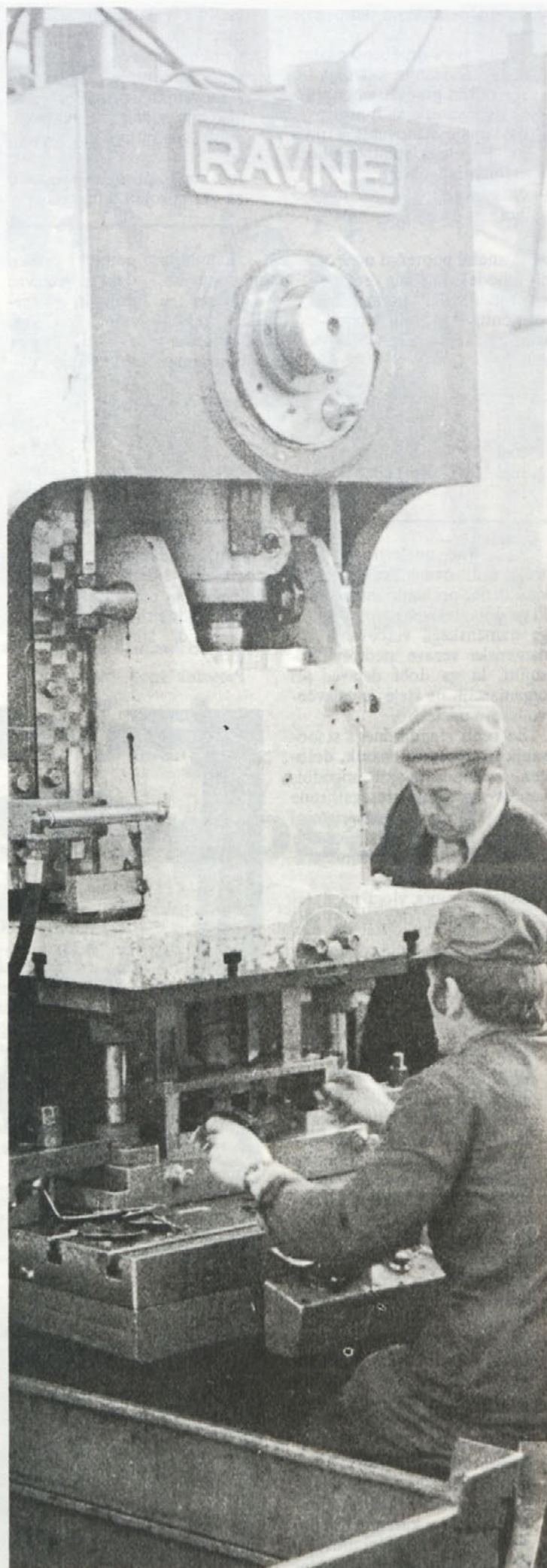
Skrb za varno delo je prisotna vsak dan. Zato obisk referenta za varstvo pri delu tudi na delovnem mestu ni nič neobičajnega