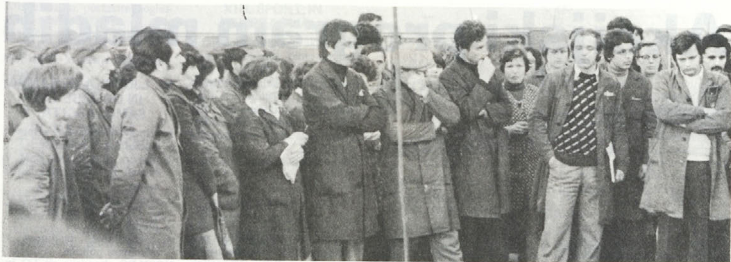
Z zbora delovnih ljudi v Tovarni prikolic.