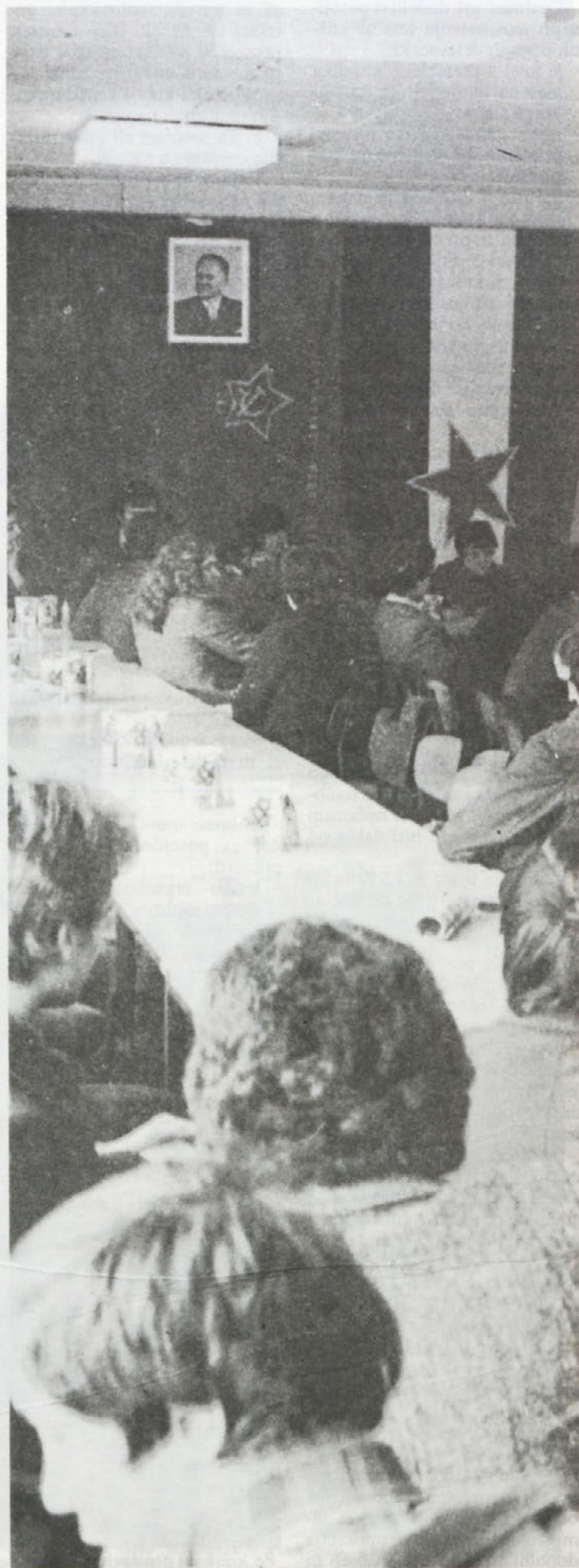
23. marca so imeli mladinci tozd Tovarne avtomobilov svoj redni letni občni zbor, na katerem so pregledali svojo preteklo dejavnost in sprejeli načrt dela za prihodnost.

Vsi kandidati so vabljeni na razgovor o študiju, ki bo 25. 3. 1978 ob 16. uri na srednji kmetijski šoli v Novem mestu.