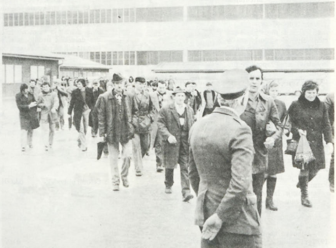
Ko odhajamo domov, se marsikdo med nami vpraša, ali je na delovnem mestu napravil vse, kar je bilo v njegovi moči. Če pa še ni tako, bi bilo dobro, da bi kdaj bilo...

formacijo o dodeljevanju posojil za stanovanjsko izgradnjo. Sredstva bodo razporejena po zaključnem računu v stanovanjski del sklada skupne porabe. Posojila bodo razdeljena po razpisu, ki ga bo pripravil poseben odbor po kriterijih iz samoupravnega sporazuma.