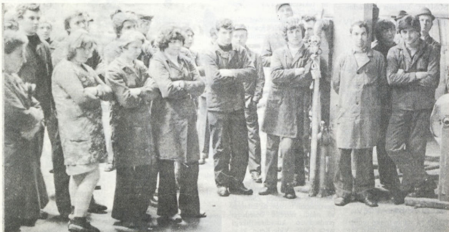
Z zbora delovnih ljudi v Tovarni avtomobilov.