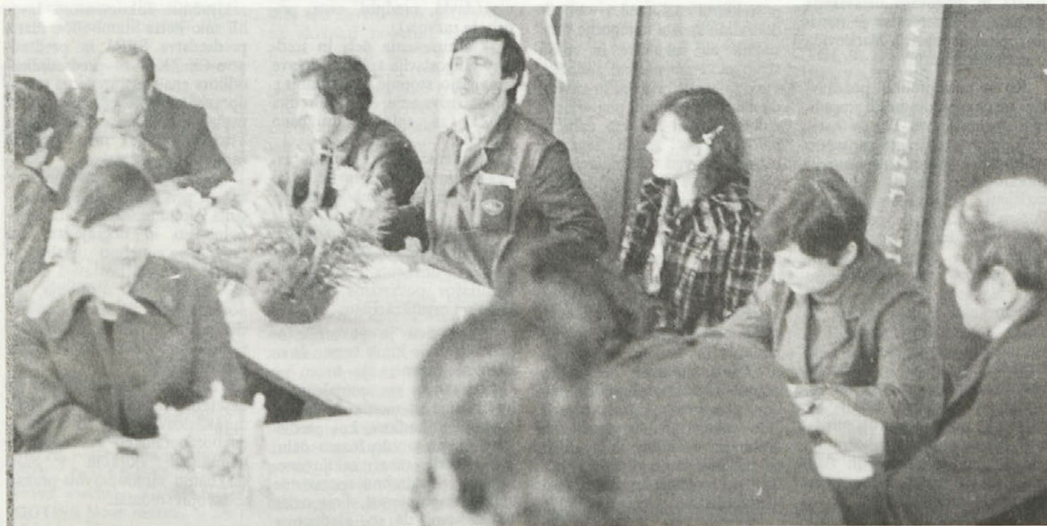
Občnega zbora ZSMS v TOZD Tovarni avtomobilov so se udeležili tudi predstavniki ZK in sindikata.