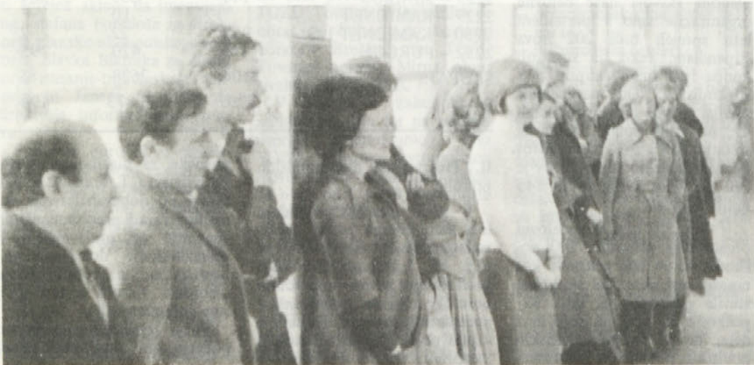
Z zbora delovnih ljudi skupnih služb.