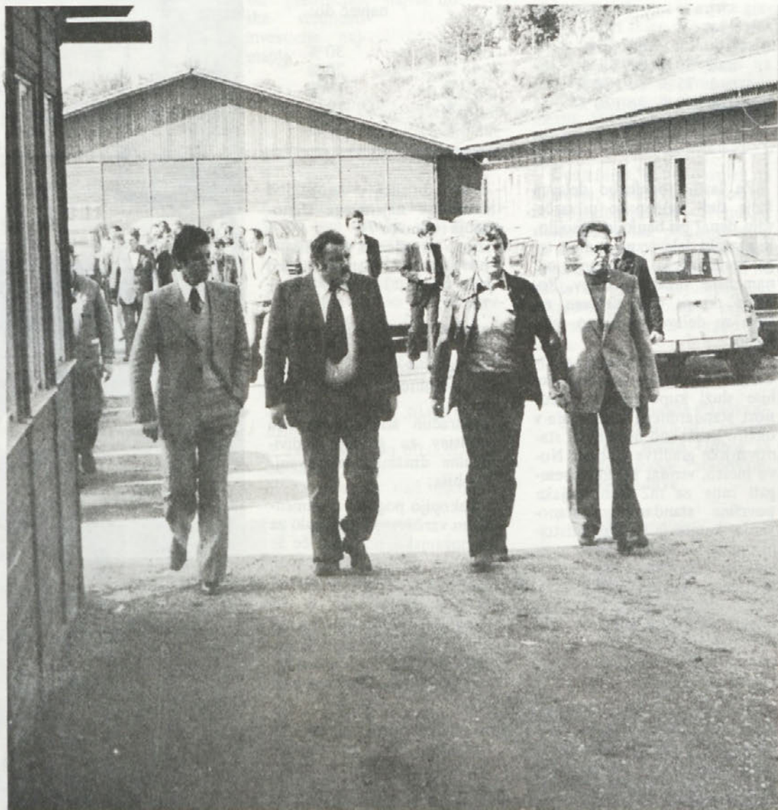
Vsako leto obiščite našo tovarno na desetine ekskurzij. Tudi tako seznanjamo učence in delovne ljudi drugih kolektivov, kako delamo pri nas.