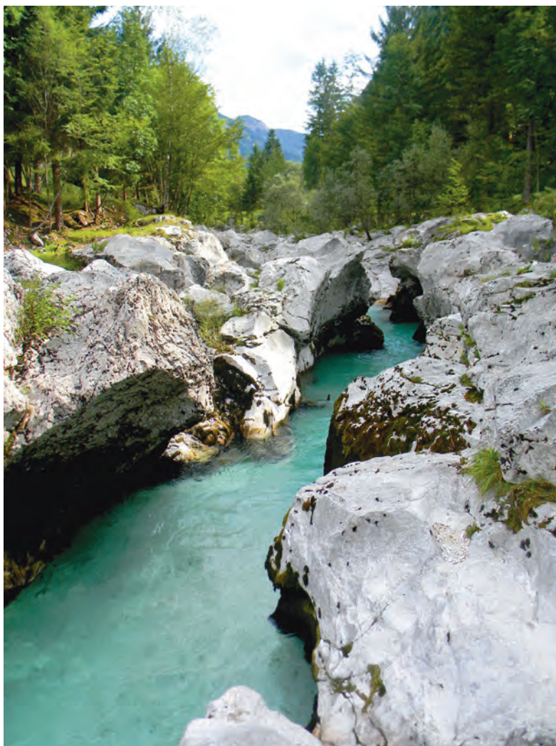
Urška Urh: Kam tečeš, reka. Druga in tretja nagrada v kategoriji od 15 do 17 let.