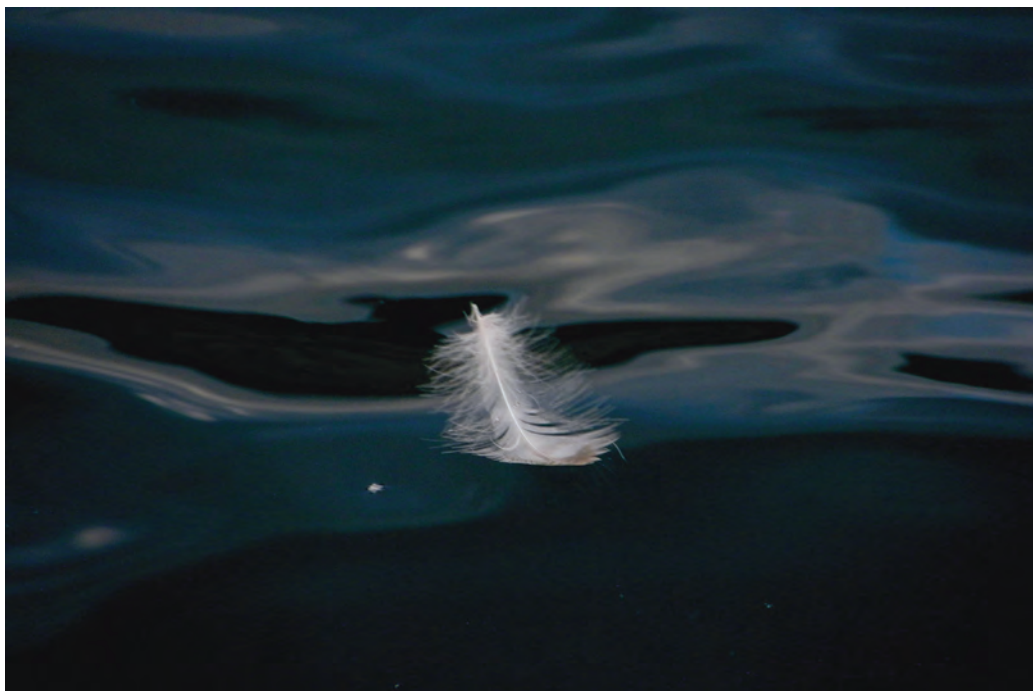
Ajda Zupan: Osamljen. Druga in tretja nagrada v kategoriji od 15 do 17 let.