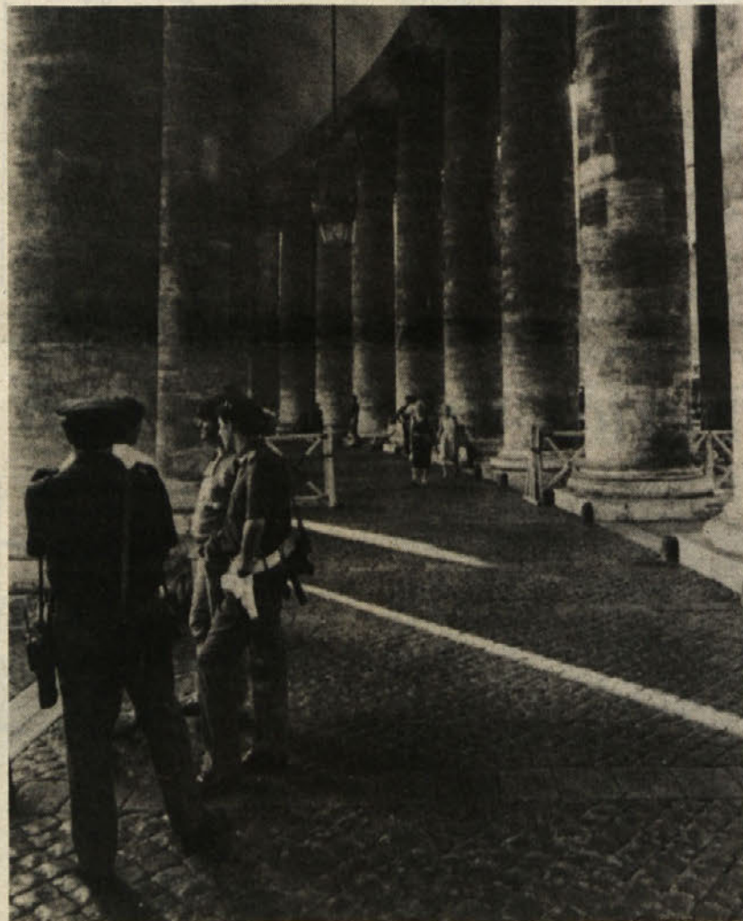
Zaradi ugrabitve Emanuele Orlandi je policija poostrila nadzorstvo v bližini Vatikana; na sliki policista na straži pri Berninijevem stebrišču na Trgu Sv. Petra