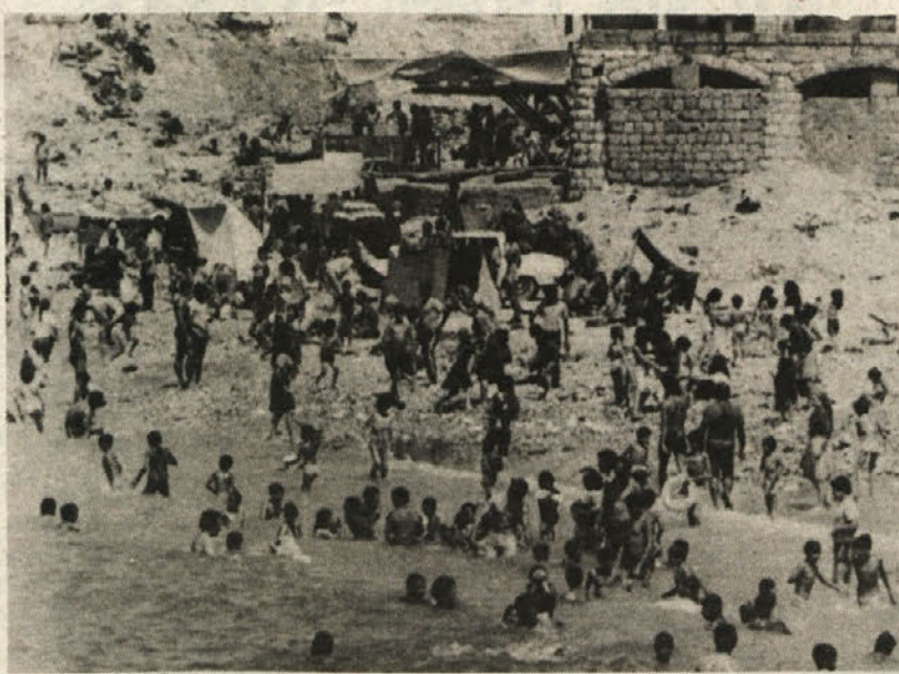
Neznosna vročina je v nedeljo privabila na plažo v bližini Bejruta številne kopalce, ki so za trenutek pozabili na tragedijo, ki jo mesto doživlja že vrsto let. Dovolj pa je bilo, da so odvrnili pogled od morja in dramatična stvarnost jim je bila takoj pred očmi