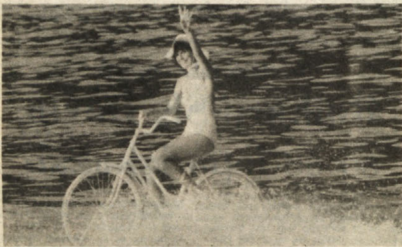
Prickupno dekle se nasmiha gledalcem, medtem ko «kolesari» po jezeru Constanca. Sicer pa ta «sport» zahteva manj truda kot kaže na prvi pogled: kolo je pritrjeno na desko, vleče pa ga motorni čoln