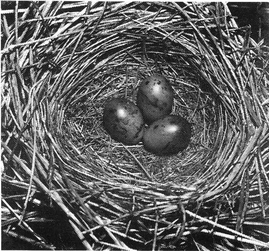
21. leglo trstnega strnada (D.Šere)