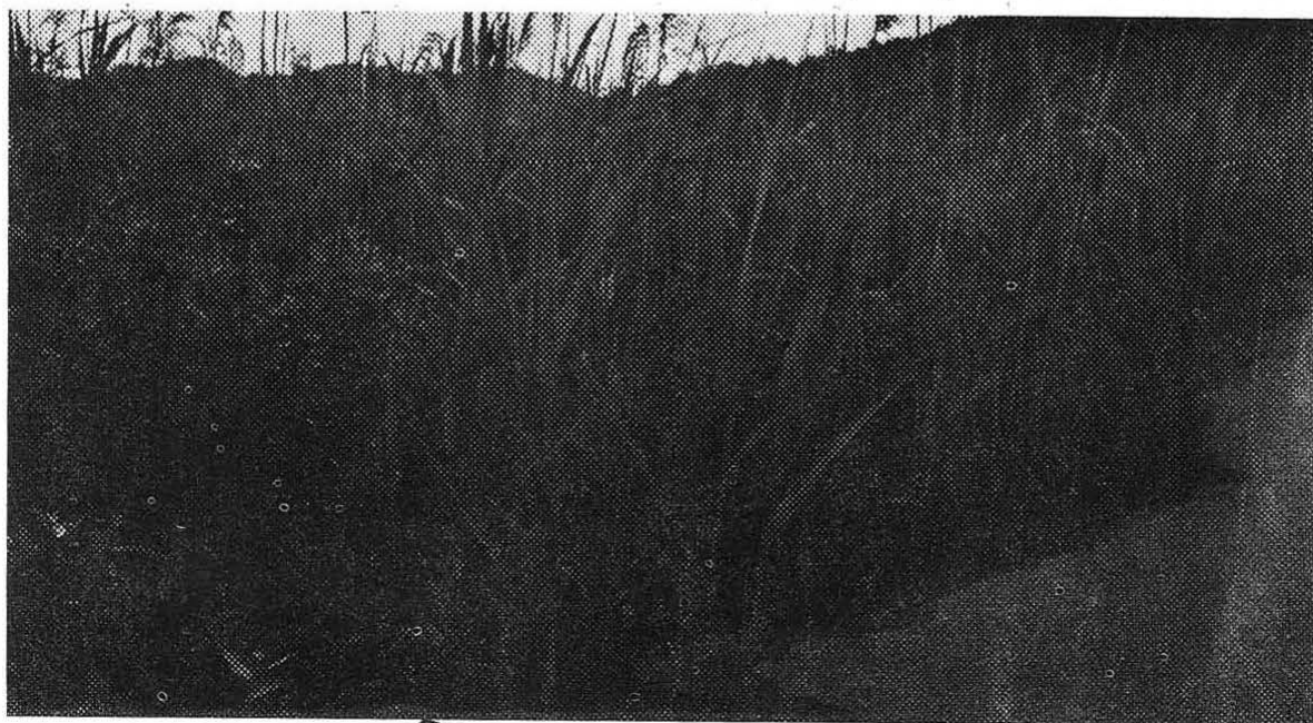
20. gnezditveni biotop trstnega strnada na Ljubljanskem barju

figure 1: recoveries in Italy of the Reed Bunting ringed in Slovenia