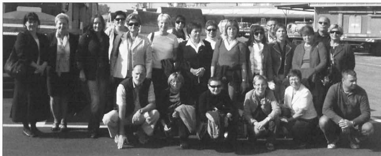
Udeleženci strokovne ekskurzije v Luko Koper