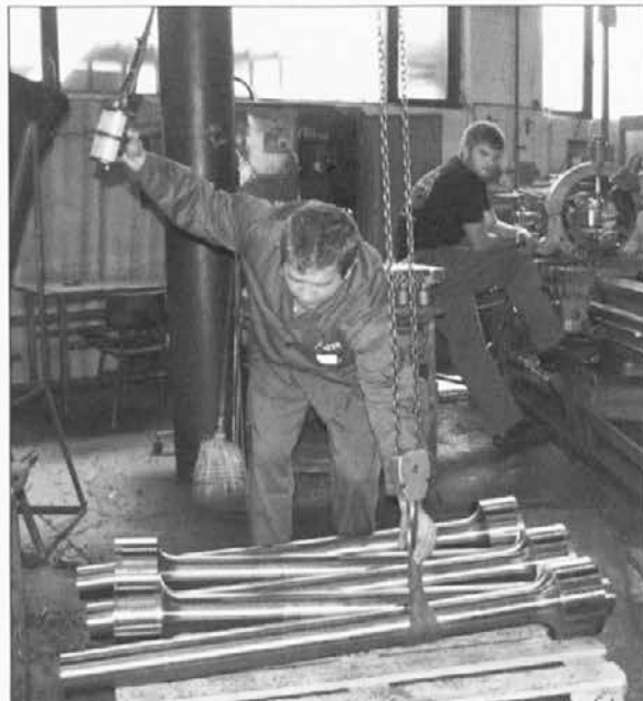
Utrinek iz proizvodnje v podjetju SŽ-Oprema Ravne

Objavljenih prispevkov ni dovoljeno kakorkoli ponatisniti brez pisnega dovoljenja uredništva.