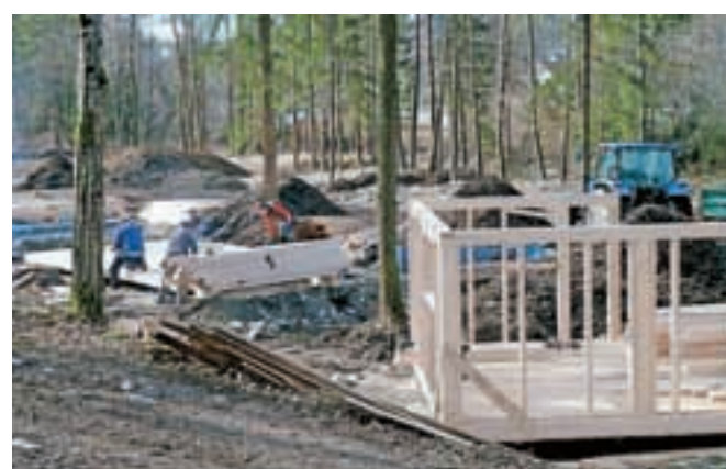
Postavitev hišk naj bi bila končana do junija, ko bodo kamp predvidoma tudi odprli.