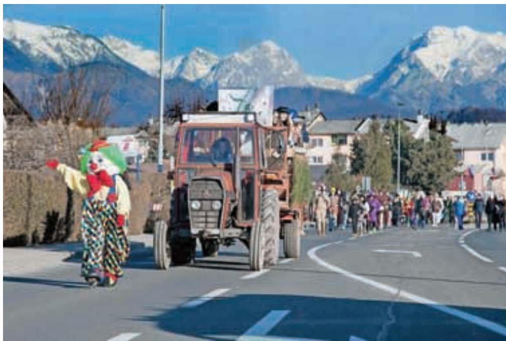
Na pustno soboto so sprevod pustnih šem na Duplici pripravili učenci in učitelji Osnovne šole Marije Vere.

Kamnik – Veselo praznovanje pusta se je na Kamniškem začelo v soboto s tradicionalno povorko maškar in pustnim rajanjem pred Osnovno šolo Marije Vere na Duplici. Maškare – večinoma učitelji, učenci (ki so tako na zabaven način preživeli delovno soboto) in njihovi starši – so se ob spremljavi kamniških godbenikov, mažoret in učencev Glasbene šole Kamnik podale na sprevod po ulicah Duplice in Bakovnika, kjer jih je v res lepem vremenu pozdravilo veliko občanov. Po sprevodu so se maškare vrnile pred šolo, kjer so izbrali najbolj izvirne in najlepše, družjenje pa nadaljevali s pustnim rajanjem.