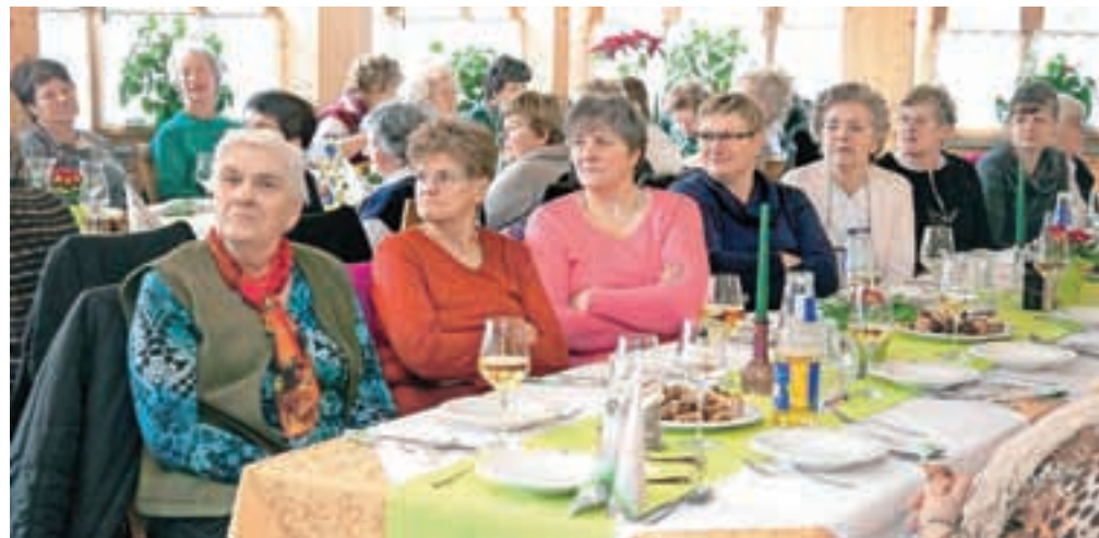
Društvo šteje okoli 70 članic z območja Komende in Kamnika.

pogostitev ob občinskem prazniku Občine Kamnik, nastopile so v oddaji Dobro jutro, kjer so predstavile, kako so nekoč jedli Kamničani. Pripravile so tradicionalne jedi, kot je denimo velikoplaninski trnič, ter druge dobrote iz lokalnega okolja. Društvo tako skrbi za promocijo kamniške in komendske regije na državni ravni. Društvo podeželskih žena Kamnik - Komenda šteje okoli sedemdeset članic. Tako kot nekatera druga društva si želijo več mladih deklet, na katere bi lahko prenašale svoje znanje in izkušnje. Poleg vseh opravil in aktivnosti v društvu pa jim včasih godi zgolj dober klepet v družbi prijateljev. Tudi za to najdejo čas, če ne drugače, pa na vsakoletnem oddihu v Termah Topolšica.