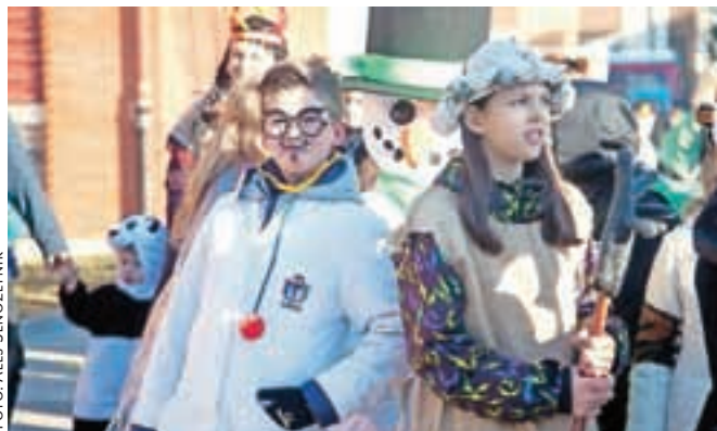
Učenci OŠ Marija Vera so poskrbeli za pester nabor mask.