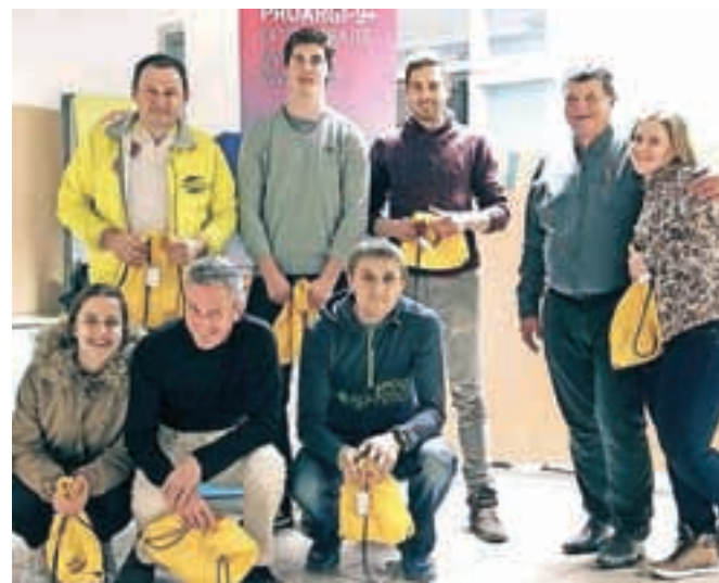
Klub ne bi deloval tako uspešno brez dobre trenerske ekipe.