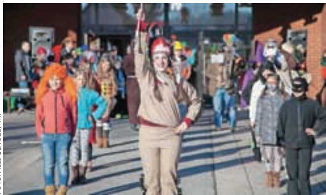
Tudi kamniške mažoretke so se zamaskirale.