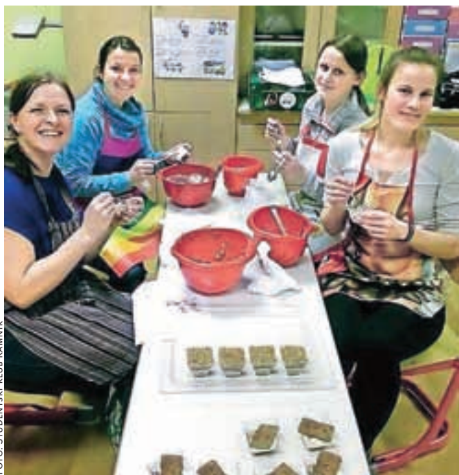
Utrinek s sladke kulinarične delavnice

Zima se še ni poslovila, a misli nam že uhajajo v mesec marec. Lotevamo se četrte izdaje dobrodelnega marca, kot smo poimenovali mesec, ko Študentski klub Kamnik še posebej intenzivno pomaga! Kljub temu, da bo letošnji februar malo daljši, se zavedamo, da bo marec prehitro pred vrati in želimo, da se vest o tem, da bomo tudi z vašo pomočjo pomagali, razširi. Ostajamo zvesti aktivnostim, ki ste jih spoznali že pretekla leta, dodajamo pa tudi nekaj novih projektov. Tudi tokrat bomo združili moči z Leo klubom Kamnik, s katerim bomo or-