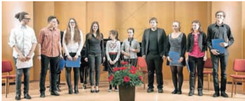
Nastopajoči pesniki in glasbeniki

Ceni največjega slovenskega pesnika Franceta Prešerna. »Mislim, da Prešeren ne more zastarati. Je vedno aktualen, mojstrski,« pove o pesniku, ki ga mnogi njegovi vrstniki ne marajo preveč. »Veliko mladih zamahne