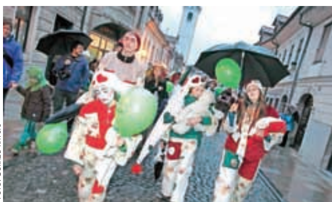
Družina zaspančkov, zmagovalna skupinska maska