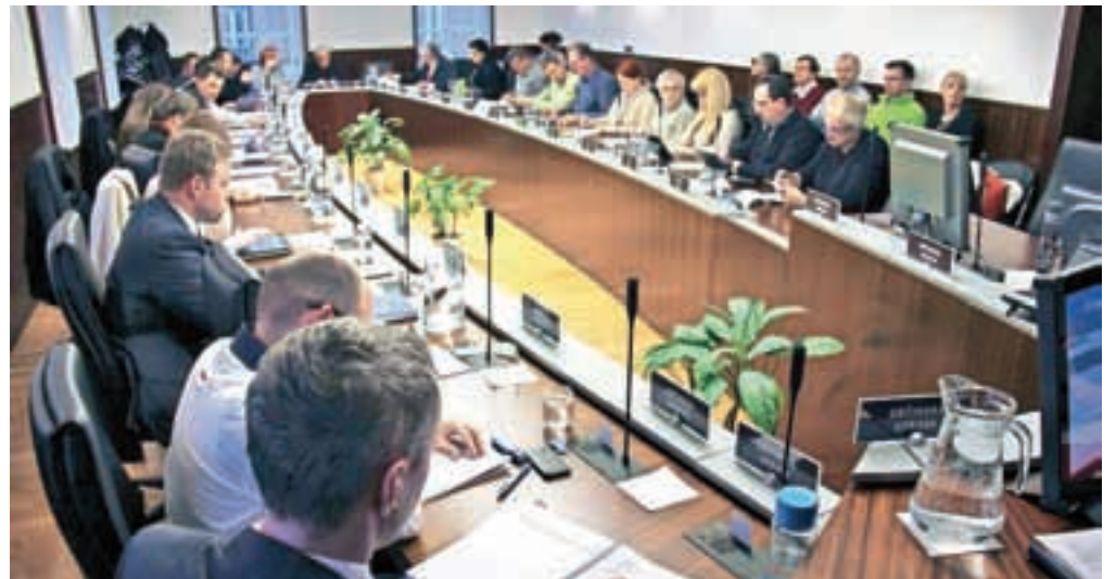
Občinski svetniki na februarski seji