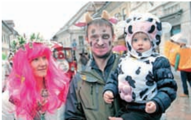
Veliko je bilo družin z majhnimi otroki.