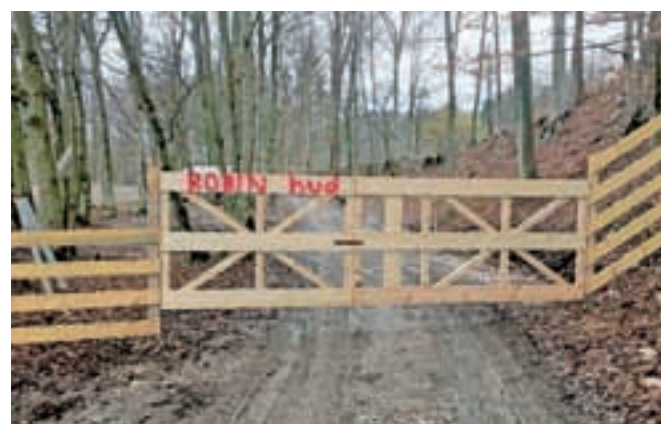
Tik pred zaključkom redakcije smo prejeli še tole fotografijo vandalizma na ograji, postavljena okoli bodočega kampa.