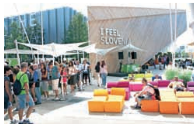
Njihovi živobarvni modularni pohištveni sedeži so navdušili že na razstavi EXPO v Milanu.

V zgolj dveh letih so s svojimi sedeži uspeli priti na zahtevne trge evropskih držav, predvsem Francije, Italije, Švice in Skandinavije, na trge Bližnjega in Daljnega vzhoda, pa tudi v ZDA, Kanado, Mehiko, Kolumbijo, Peru, Rusijo in Tajvan. Njihovi kupci so zahtevnejše stranke, in sicer dizajnerske trgovine in opremljevalci objektov v višjem cenovnem razredu. »V tujini postajamo močno prepoznavni, a vsi naši izdelki so plod slovenskega znanja in dela. Sodelujemo namreč izključno s slovenskimi kooperanti. V Kamniku in bližnji okolici so to bolj posamezni mojstri, s katerimi sodelujemo pri prototipih in manjših serijah, ostali kooperanti za šivanje, les in peno ter naša skladišča pa so po vseh koncih Slovenije. Naša ključna skrb v tem trenutku je proizvodnjo organizirati na način, da bomo lahko zadostili vsem potre-