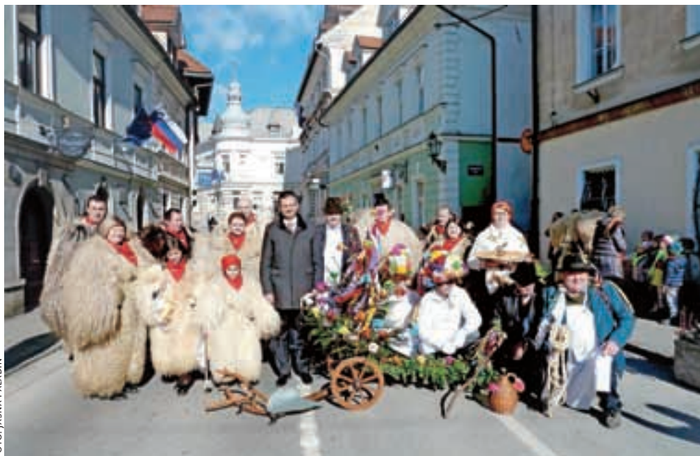
Župan Marjan Šarec v družbi članov pustne skupine Orači iz Jablovca pri Podlehniku