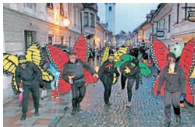
Pustni torek pa je bil v znamenju Kamniškega karnevala, ki pa mu je letos zagodel dež.