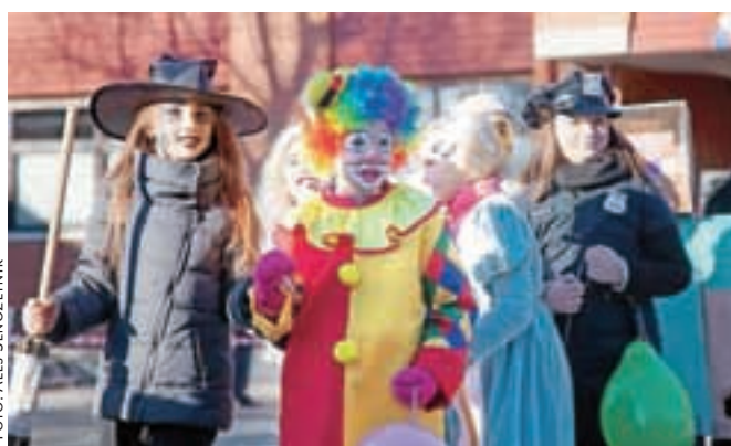
Klovni in čarovnice so vedno priljubljeni med mladimi.