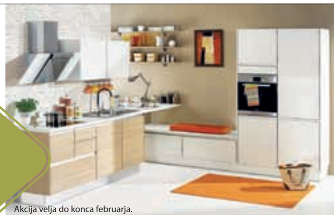
Akcija velja do konca februarja.