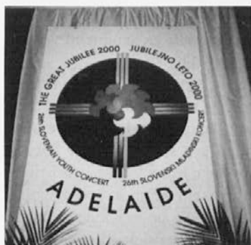
Logo je izdelala Anita Nett

26. MLADINSKI KONCERT v priredbi slovenskih verskih središč v Avstraliji je bil letos v soboto 8. julija 2000 v dvorani slovenskega kluba Adelaide. Geslo letošnjega koncerta je bilo VELIKI JUBILEJ 2000. Koncert je imel še poseben pomen, saj smo v jubilejnem letu 2000, ko obhajamo spomin našega odrešenja in osvoboditve. Jubilej je tudi klic k počitku ljudi in zemlje, in čas za razmislek in nove načrte... Jubilej je čas praznovanja, čas velikega veselja in hvaležnosti za darove, ki smo jih prejeli od Boga in da jih uporabljamo v božjo čast in blagor človeške družbe.