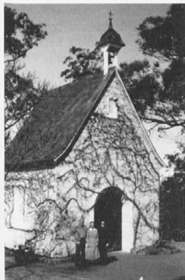
Romarsko Marijino svetišče na Mount Schoenstatt, Mulgoa