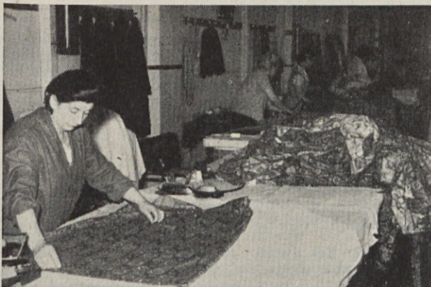
Delavka izdeluje ravno zastavo za Ruando