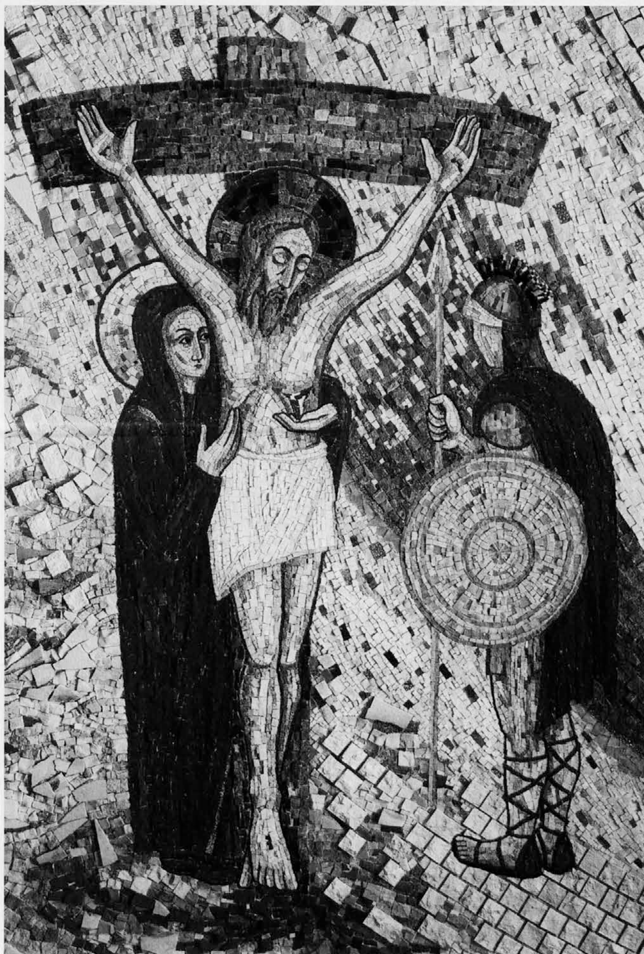
MARKO IVAN RUPNIK: KRIZANJE, KAPELA REDEMPTORIS MATER PAPEZA PAVLA II.