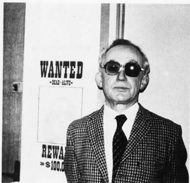
Doma decembra 1985