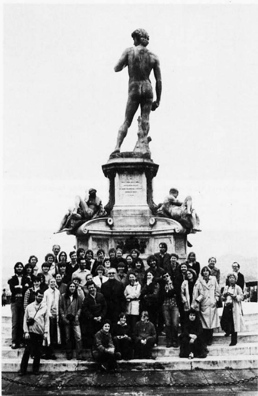
Ekskurzija oddelka za umetnostno zgodovino maja 1980, Firenze, Piazzale Michelangelo