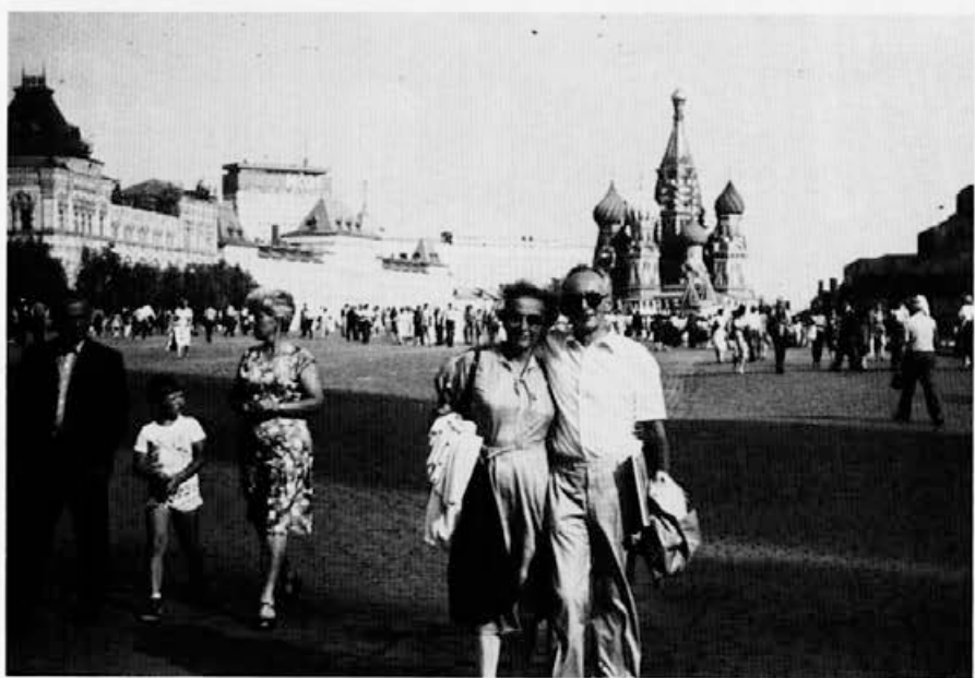
Z Ljerko v Moskvi na Rdečem trgu julija 1984