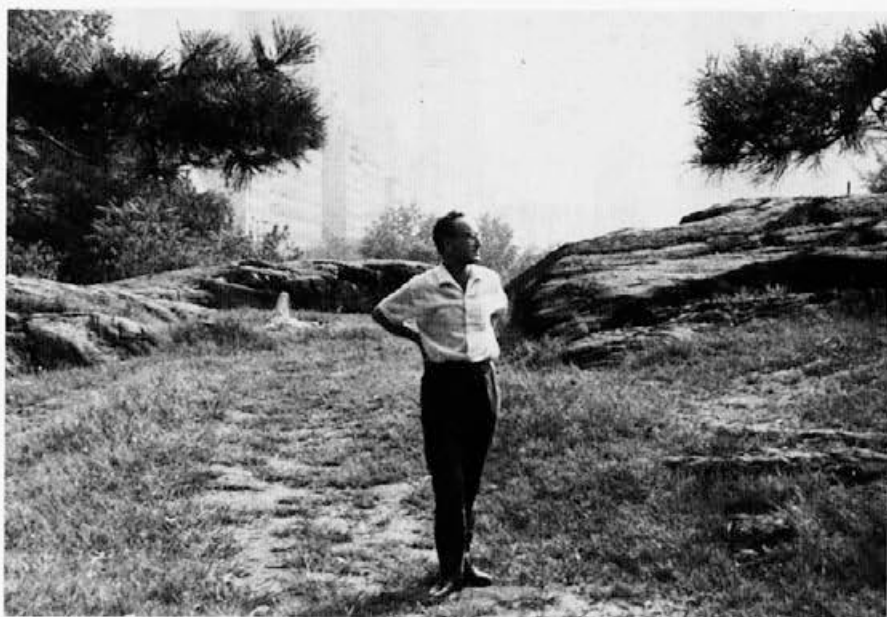
New York, Central Park poleti 1964