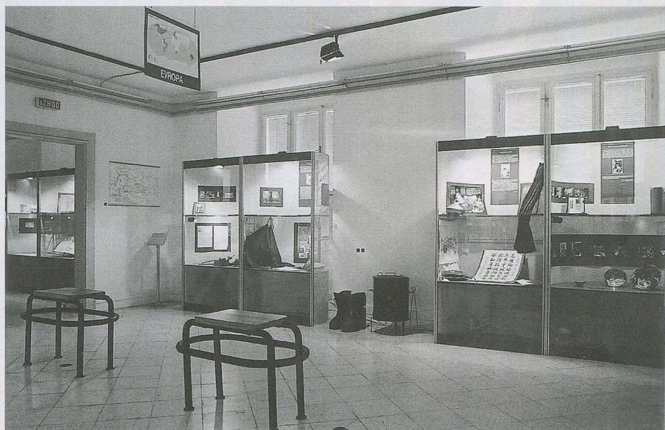
Pogled v razstavni prostor.