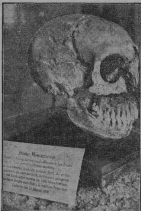
Lobanja najstarejšega človeka so našli pred 25 leti v votlini pri Le Moustieru na Francoskem. Lobanja ima 33 lepih zob. Sodijo, da ta človek ni bil več star nego 16 let.

Nekaj pojasnila k zagonetni najdbi ženskega okostnjaka v gozdiču blizu Krškega. Zadnjič smo poročali o najdbi popolnoma razpadlega ženskega trupla v gozdiču pri Krškem. Truplo je moralo ležati v gozdu eno leto dni. V ročni torbici neznanke je bilo med drugimi predmeti tudi sledeče pismo: »Nočem več živeti. Nihče ni kriv moje smrti. Za svoje delo odgovarjam pred Bogom. Pokopljite me tu, kjer me najdete. Ne iščite, kdo sem in kaj sem. Če bi ta gozd znal govoriti, bi vam pripovedoval žalostno zgodbo. Vse je končano. Želim miru, želim, da bi se vse pozabilo. Smrt je strašna, počasnejše umiranje pa je še hujše. Mi nismo ljudje, marveč samo igrače usode, ki počne z nami, kar hoče.« Pismo nosi da-