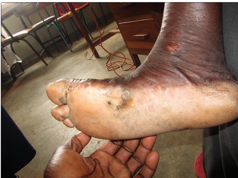
Slika 4. Trofične spremembe, značilne za bolnike z lepromatozno obliko lepre, ki nastanejo zaradi okvare perifernega živčevja.