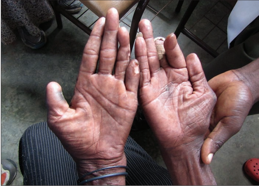
Slika 5. Bolnik z lepromatozno obliko lepre. Amputirani prsti zaradi resorpcije kostnine in kot posledica več poškodb in opeklin zaradi izgube občutka za dotik.

do bolečine v modih, neplodnosti in ginekomastije. Pri lepromatozni obliki bolezni so prizadete tudi ledvice (glomerulonefritis, nefritis ali amiloidoza ledvic) in prav odpoved ledvic je pri teh bolnikih pogost vzrok smrti (16, 17).