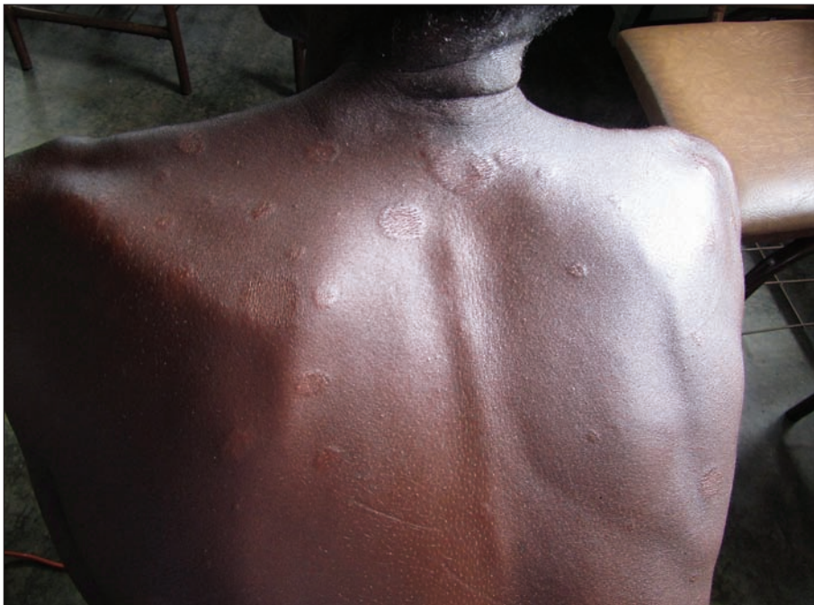
Slika 3. Bolnik z lepromatozno obliko lepre. Na koži hrbta so vidni številni plaki.