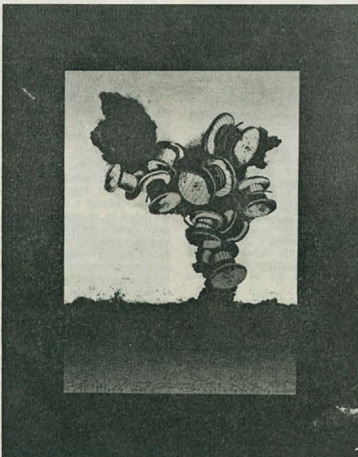
Mir '75 — 30 OZN — Jože Spac: Eksplozija, barvni sitotisk 1974