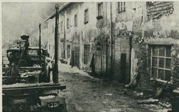
»Iz nekdanjega hleva smo uredili mehanične delavnice«

(Nadaljevanje s 3. strani) smo bili po dvigu osebnih dohodkov 12. tega meseca ponovno blokirani zaradi izposojenih sredstev iz rezervnega sklada.