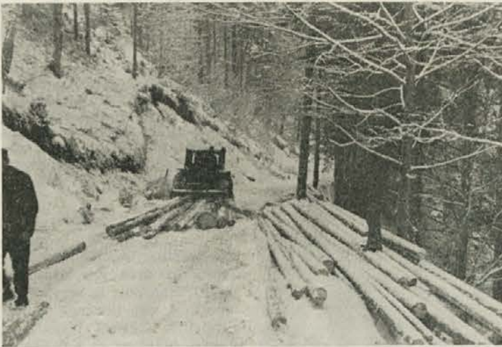
Traktorska izvleka