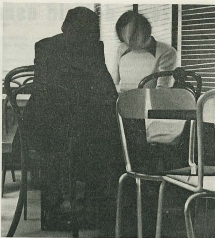
Mir '75 — 30 OZN — Franc Mesarič: Interieur motel, acryl 1975