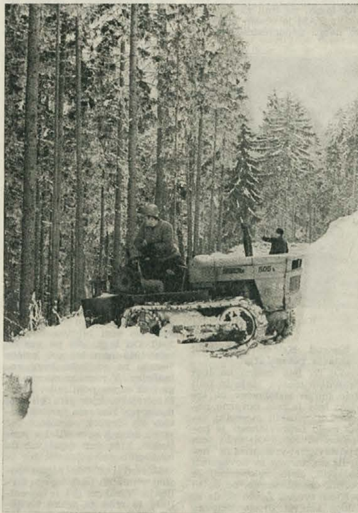
... Samo malo nepredvidnosti je treba in že ...