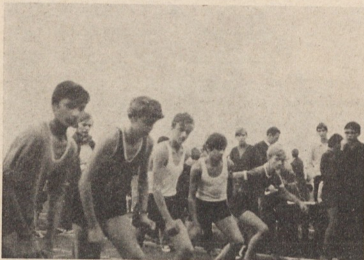
Na jesenskem občinskem prvenstvu osnovnih šol v atletiki so bili doseženi zadovoljivi rezultati. Posnetek prikazuje tek pionirjev

Sodelovalo je skoraj 200 tekmovalcev z vseh petih osnovnih šol.