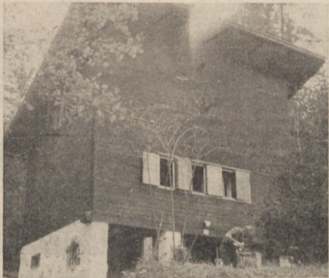
Dom Počitniške zveze Ljubljana Moste-Polje na Visokem v Poljanski dolini

sredstvi so temeljito popravili streho, sezidali dimnik, zunaj in znotraj prepletkali stene, okna in vrata, uredili in opremili sanitarije in kuhinjo, zgradili no-