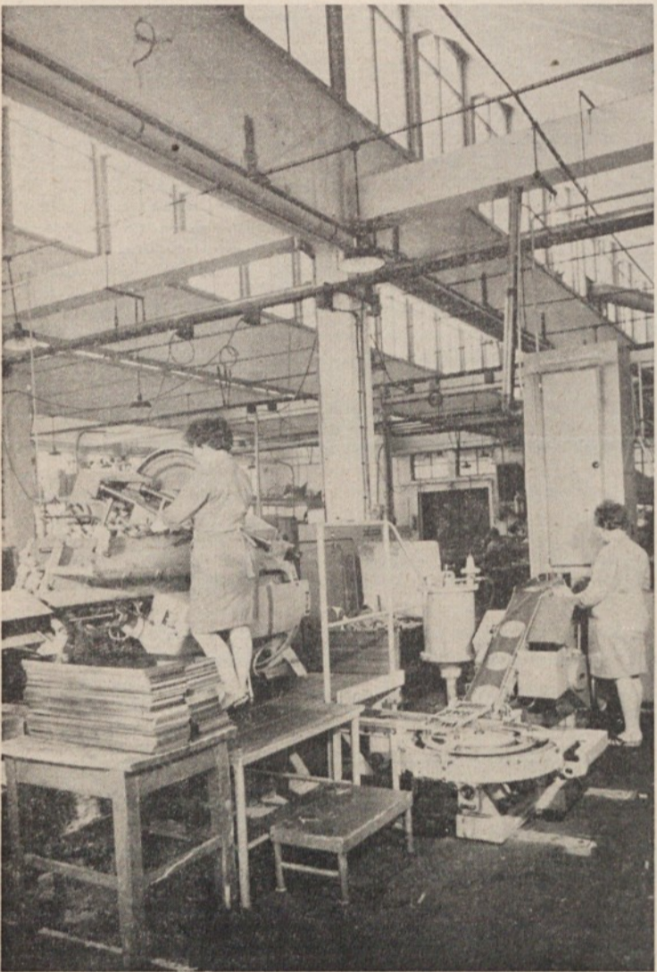
Štancanje pokrovov in robljenje konzervnih škatel v modernem obratu Saturnusa v Zalogu

Vemo, da je smiselno gospodarstvo le v stalni modernizaciji, v avtomatizaciji proizvodnje s čim manj človekovega fizičnega dela, kar pa zah-