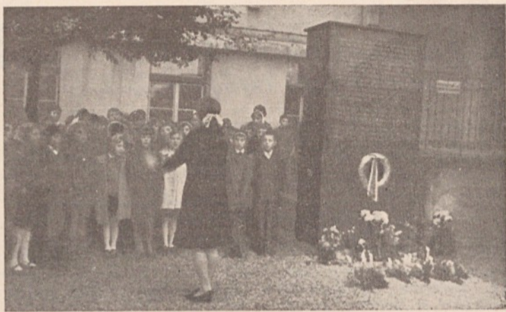
Tudi letos se bomo ob Dnevu mrtvih z mnogimi spominskimi svečanostmi spomnili umrlih svojcev, padlih borcev in žrtev fašističnega terorja.

Večkrat se je že pripetilo, da je voznik z dokajšnjo hitrostjo pripeljal v hodnik in se je samo njegovi prisebnosti in pazljivosti zahvaliti, da ni prišlo do usodnega trčenja z mladim kolesarjem, ki je v trenutku od nekd pridivjal.