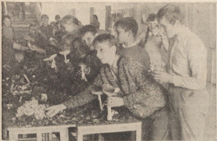
Za letošnjo jesen so v Ljubljani pripravili mnogo razstav gob. Ena je bila tudi na osnovni šoli Jožeta Moškriča v Novih Jaršah. Ker se je letos precej ljudi z gobami zastrupilo, bi bilo prav, če bi naslednjo jesen tudi druge šole pripravile podobne razstave. Tako bi tudi šolarji, med katerimi je veliko navdušenih gobarjev, znali razlikovati užitne gobe od neujitnih.

4. Republika pa naj mestu zagotovi sredstva za tiste zadeve, ki jih naj prenaša, in za tiste objekte, ki niso le mestnega značaja (ceste I. do III. reda, mostovi ipd.).