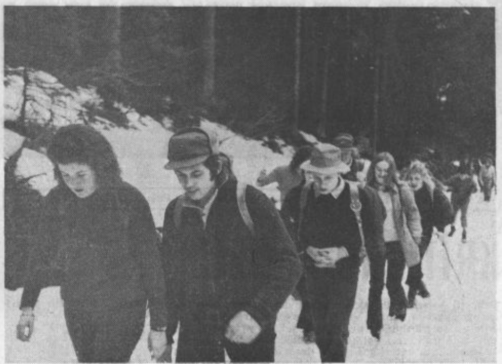
Po poteh Štirinajste divizije