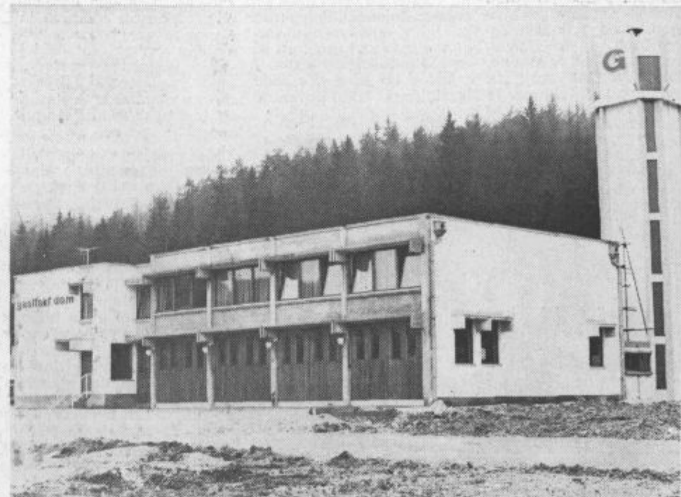
Gasilski dom v Velenju so gasilci že napolnili