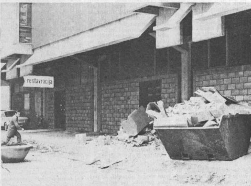
Takšna je vsakdanja podoba razmetane embalaže pri novi veleblagovnici ljubljanske Name v Velenju