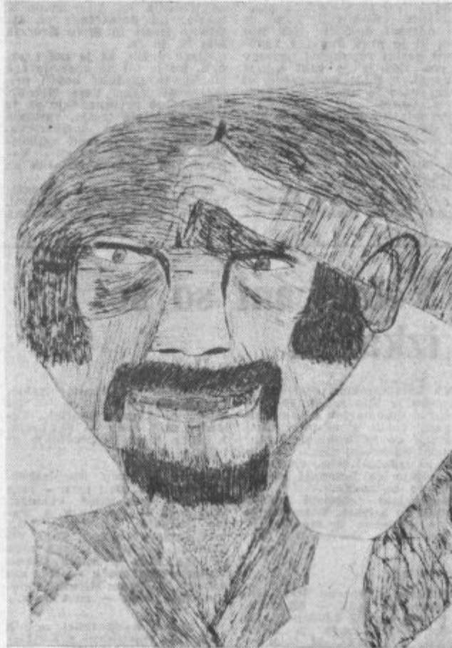
Cesanje — risba, Andrej Zaveršnik, o. š. Polzela