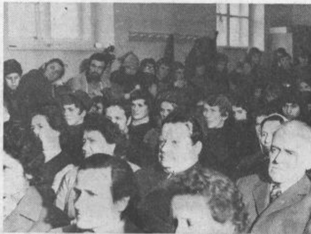
Borci, domačini in mladina na partizanskem mitingu v Zavodnjah

Končal se je letošnji peti spominski pohod po poteh Štirinajste divizije, poslovičili smo se od prijaznih Zavodnjčanov in se z avtobusom odpeljali v dolino. Pohod je bil koristen Marsikdo od udeležencev je