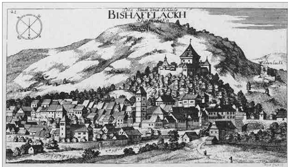
Škofja Loka po Valvasorjevi Topografiji Kranjske, 1679 ( Topographia Ducatus Carnioliae Moderna , št. 21).