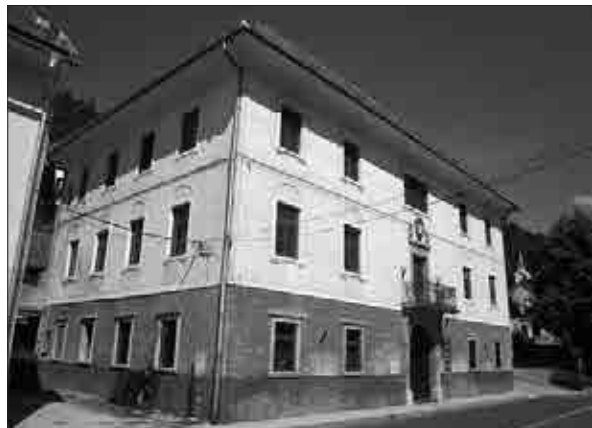
Kosova graščina na Jesenicah danes.