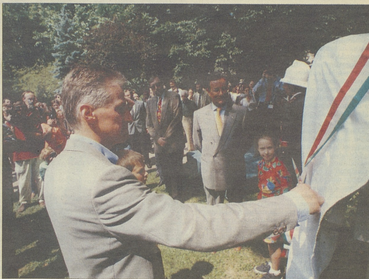
Trak na še pokritem doprsnem kipu je na včerajšnji slovesnosti prerezal tržaški zupan Riccardo Illy