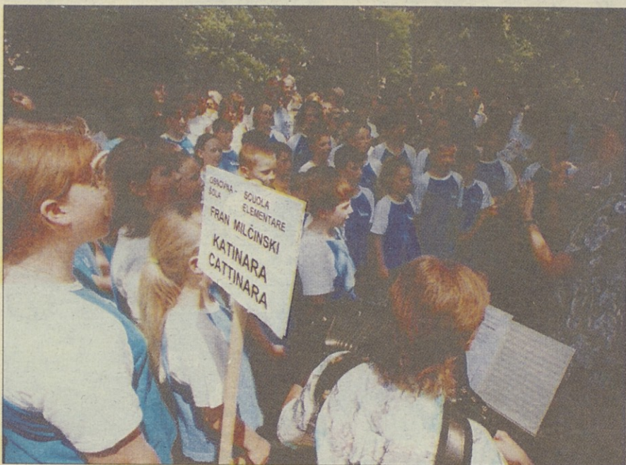
V Ljudskem vrtu so včeraj zapeli tudi učenci katinarske osnovne šole

ber govoril o Kosovelu, ki je »po mnenju mnogih najpomembnejši slovenski pesnik dvajsetega stoletja«, kot o »enemu glasnih in lucidnejših kritikov Evrope, ki je zabredla v prvo svetovno vojno in po njej nemo zrla v nastopanje prihajajočega fasizma«. Pesnik je v Evropi iskal možnost sobivanja v razlikah, spostovanja, morda vsaj priznavanja posebnosti, je se poudaril slovenski minister. »Za Evropo, ki bi nam vsem, sirom po Evropi, in se posebej tu ob meji - stiku dveh nacij - dala priložnost živeti svobodno in razumeti drug drugega, je bil Kosovel pripravljen vzklikniti: Naj živi Evropa!« Naj zato z njo in v njej, je ob koncu zazelel Slavko Gaber, živi tudi Trst. (bip)