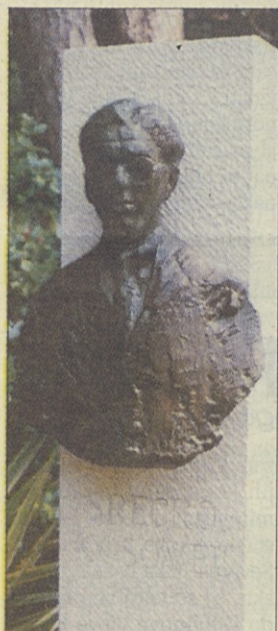
Novi Kosovelov doprsni kip