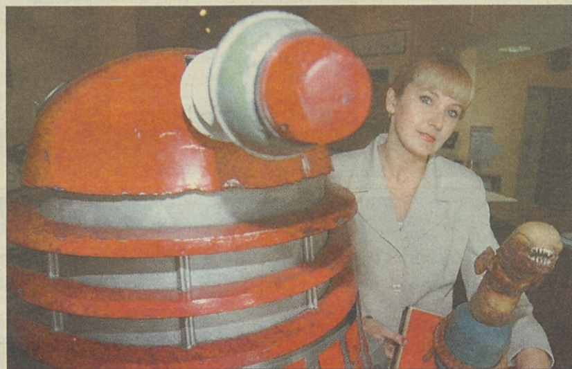
Gospodična Amanda kaže model malega Marsovca, ki je leta 1979 nastopil v filmu Alien in ga zdaj čaka prodaja na dražbi. Izključna cena je 50 milijonov lir.