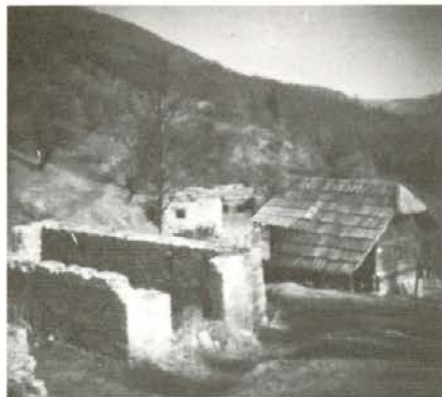
Rostna domačija Kristavc po prodaji leta 1958 ...

Skoro vsi agrarni interesenti, ki jim je bilo posestvo dodeljeno, so se morali zaposliti, da so lahko vzdrževali družine, popravljali gospodarska poslopja in stanovanjske hiše, plačevati davek od dohodka ki pa ga pravzaprav ni bilo. Tako so nekateri posestva vrnil, nekateri pa, če so imeli priliko, pod ceno prodali. Tako se je zgodilo tudi s Kristavškim gruntom. Zaradi slabih letin in visokega zemljiškega davka in