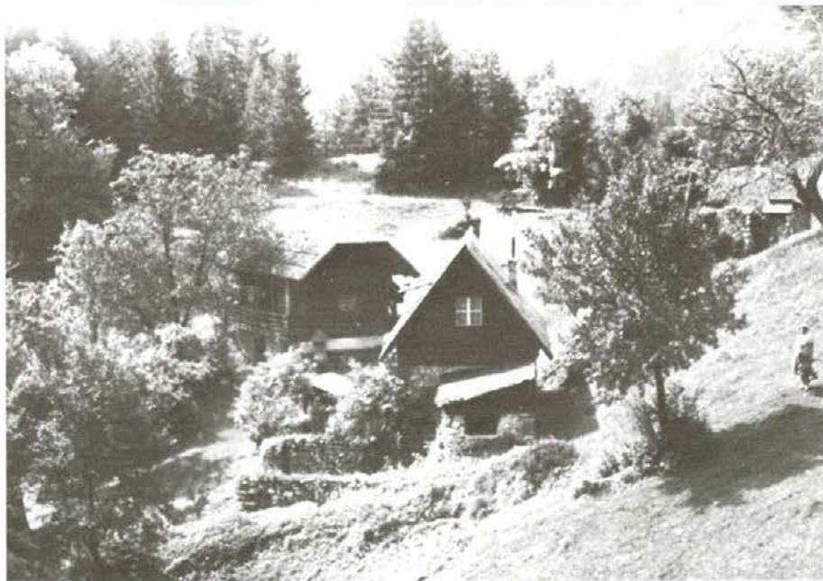
... in danes, delno obnovljena in ohranjena poznejšim rodovom.