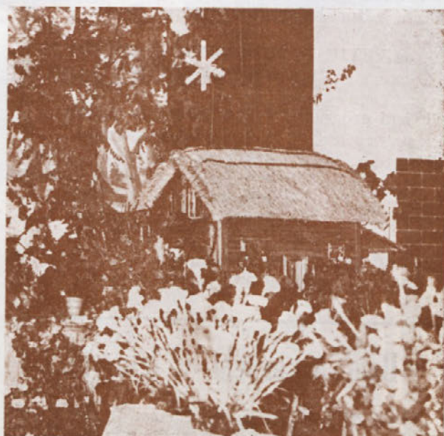
Z razstave na Bizeljskem

V ozadju odra smo videli na vzpetini silhueto bizeljskega gradu, kakršen je še danes. Pred okoli 1000 leti se je v njem pričelo življenje in so pod njim nastale prve naselbine: Pod naslovom »Bizeljsko skozi čas« nam je grad prikazal dobo fevdalizma, pred njim pa smo opazili predmete, ki so simbolično predstavljali upor tlačanih kmetov pred 400 leti.