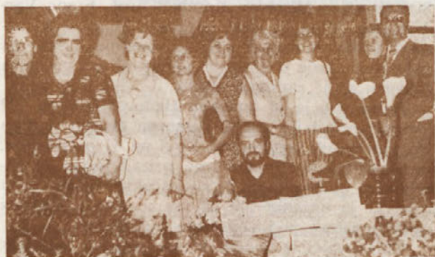
Člani kluba »Ikebane« iz Zagreba pred svojim razstavnim prostorom

Razstava v Brežicah je bila izpopolnjena s povorko po mestu s sodelovanjem šol in podjetij ter nastopom pevskih zborov iz Spodnjega Posavja in Radeč. Nastopilo je 277 pevcev s 36 pesmimi. Na razstavi na Bizeljskem je sodelovala tudi Lovska družina Bizeljsko z razstavljenimi lovskimi eksponati in trofejami ter delnim prikazom vinogradništva na Bizeljskem.