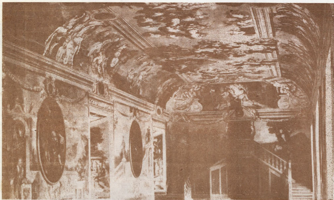
Malo je mest, ki bi se lahko pohvalilo s tako lepimi dvoranami kot je viteška dvorana v gradu Brežice

Na srečanju pevskih zborov Spodnjega Posavja prireditve »Cvetje in pesem 72« so sodelovali: