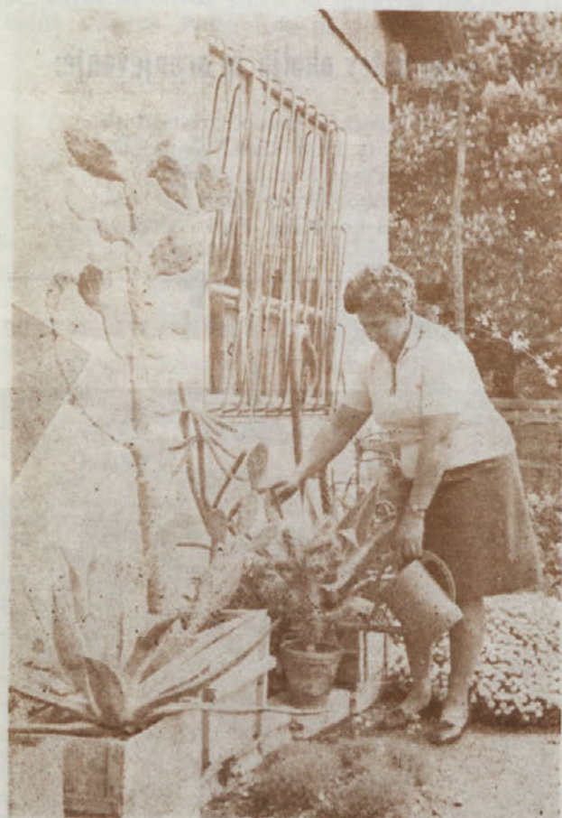
Med ljubljenci — kaktusi

»Ko sem dobila prve primerke kaktusov, sem jih vzljubila. Po nje sem morala potovati v Maribor, Ljubljano, Zagreb, pa tudi preko meje naše države, predvsem v Gradec in Trst. Prosti čas, ki ga posvečam svojemu hobiju, me stane tudi precej materialnih sredstev. Po površni oceni, ki sem jo nedavno naredila, sem v preteklem letu porabila preko 2.500 novih dinarjev za nabavo novih primerkov kaktusov, za zemljo, zabožčke, sredstva za gnojenje, zimsko gretje prostorov in drugo.«