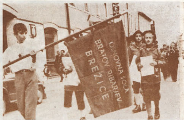
V cvetlični povorki je sodelovala tudi mladina

Pevski zbor osnovne šole Brežice je v enotnih oblekah deloval zelo efektно, nosili so vsak svoj šopek nageljnov. Zelo domiselno je bil prikazan voz s starim kmečkim pajklom za žito, v katerega so me-