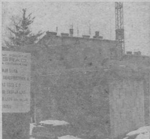
Vzgojnovarstveni zavod Zgornja Šiška, 120 mest

Od petnajstih objektov ki so bili na območju občine Ljubljana-Šiška zajeti v II. samoprispevek, bo v letu 1981 zgrajenih 140 objektov. Za pričetek gradnje preostane še izgradnja VVZ prostora v soseski Stara cerkev ŠS 4/1, ki se navezuje na pričetek gradnje stanovanj.