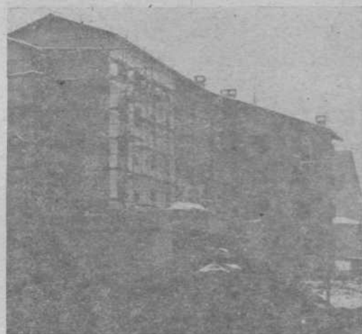
Vzgojnovarstveni zavod Medvode, stanovanjski bloki Preska, 90 mest