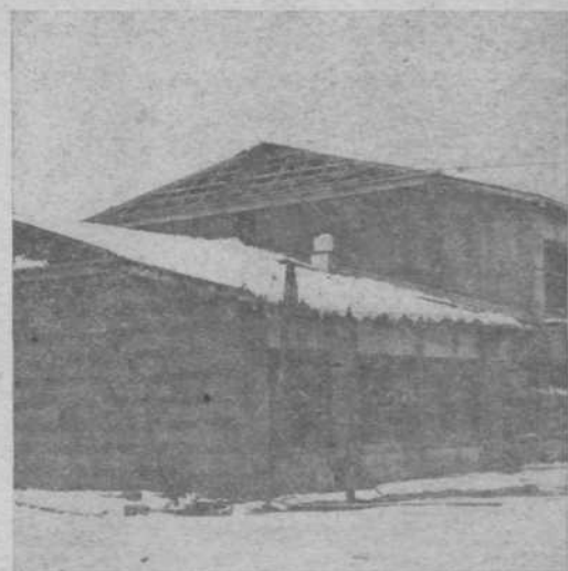
Osnovna šola Medvode-Svetlje, 14 učilnic, z večnamenskim prostorom, zakloniščem, telovadnico