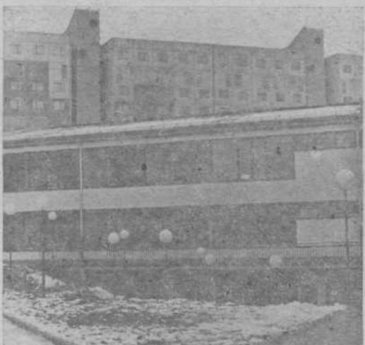
Osnovna šola v KS Dravlje, 24 učilnic, velika in mala telovadnica, kuhinja za 1.200 obrokov, večnamenski prostor, zobna ambulanta