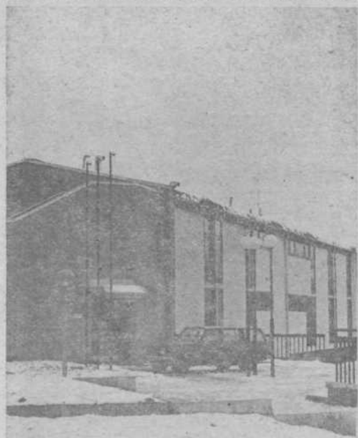
Vzgojnovarstveni zavod v KS Dravlje, 180 mest