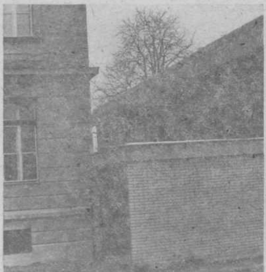
Osnovna šola Franc Rozman-Stane, prizidek s telovadnico, večnamenskim prostorom in zakloniščem