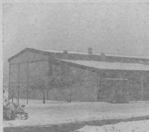
Osnovna šola Simon Jenko, prizidek s kuhinjo, telovadnico, večnamenskim prostorom in zakloniščem