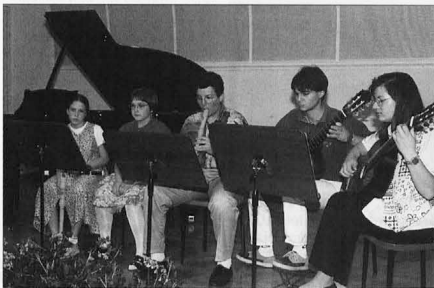
Skupinica na sobotnem nastopu