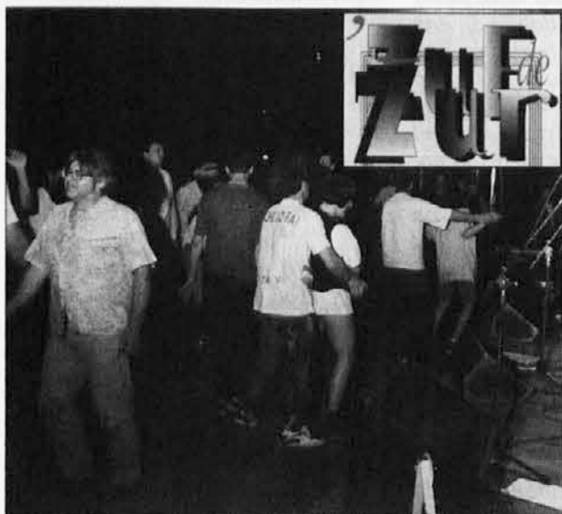
Slika s trodnevnega mladinskega praznika v priredbi gorškega 'Zuf de Žura

Naslednja številka bo izšla enkrat septembra; uredniki že sedaj pozivajo vse ljudi dobre volje, naj se jim pridružijo kot novi sodelavci, ki se zavzemajo, da se še razvije značaj Gorice kot večetničnega in večjezikovnega bogatega kulturnega prostora. Zato želimo reviji še dosti zagona in pričakujemo septembersko številko. DD