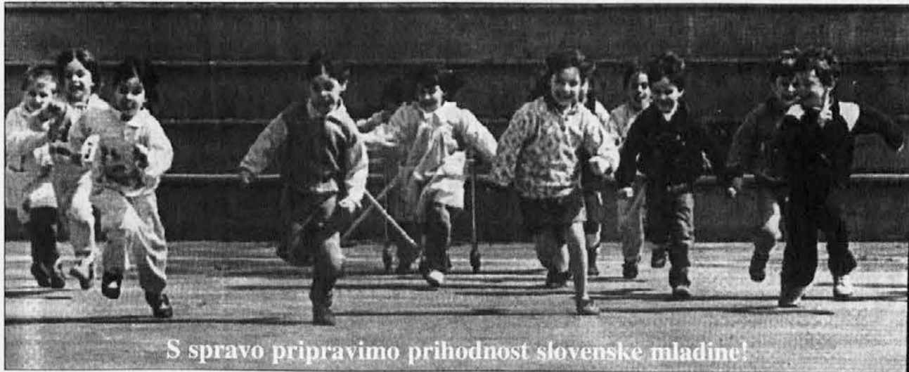
S spravo pripravimo prihodnost slovenske mladine!