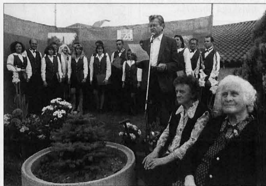
Pevski zbor in v ospredju zadnji dve škedenjski krušarici

V nedeljo, 18. junija, so v prostorih etnografskega muzeja v Škedenju odprli razstavo starih razglednic Trsta in Škedenja. Prireditelj je potekala v znamenju proslavljanja 20-letnice muzeja, o katerem smo v našem listu že pisali.