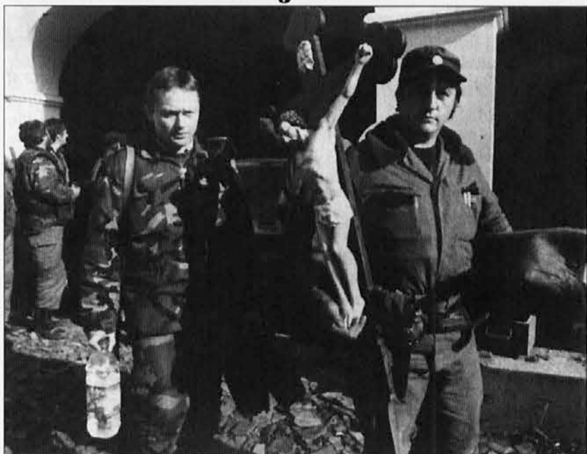
Z domov preganjajo družine in katoliška znamenja

Pozornost svetovne javnosti je usmerjena na Sarajevo, toda položaj je težak tudi drugod v Bosni. V Zagrebu je od 6. do 8. junija zasedala škofovska konferenca. Ob koncu so škofje izdali poseben poziv na svetovno javnost in na diplomatske zastopnike petih držav. V njem tožijo o težkem položaju Hrvatov v banjaluški škofiji. Gre za načrtno delo izkoreninjanja katoliških Hrvatov iz teh krajev. Posamezne tolpe, pa tudi redne vojaške edinice vdirajo v domove in s silo izganjajo ljudi iz njihovih hiš. Od 80 tisoč Hrvatov je danes v škofiji morda le še kakih 20 tisoč. Na njihove domove naseljujejo srbske družine. Škof Komarica, ki kljub grožnjam ostaja na svojem mestu, pa vztraja; z njim vztrajajo tudi redovniki in redovnice, dokler jih s silo ne izženejo, kot se je že zgodilo.