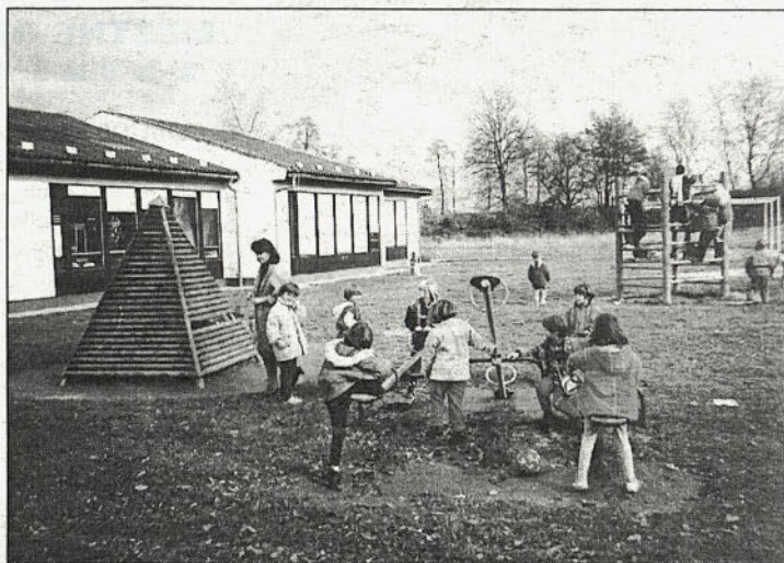
Igra otrok na igrišču vrtca

Poseben problem predstavlja delitev nekdanje občine Ptuj v 9 novo nastalih občin. Naš zavod ima svoje organizacijske enote in oddelke v Mestni občini Ptuj in občinah Kidričevo, Majšperk, Dornava, Juršinci, Vitomarci-Trnovska vas, Videm in Zavrč. V