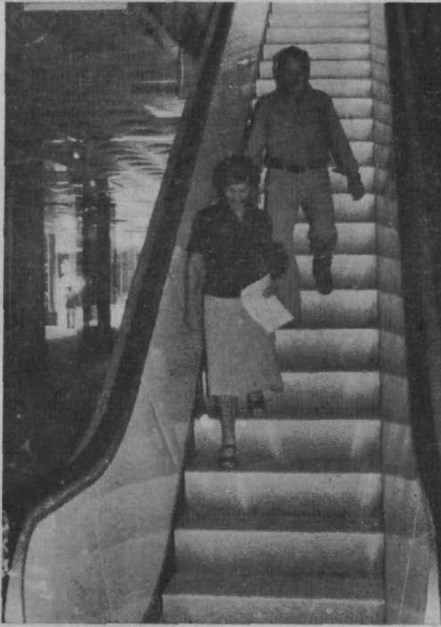
VLJUDNO VABLJENI V PODZEMLJE – Nasproti blagovnice Astra ob Titovi cesti, zraven gostinsko-prehrambenega centra Laguna, pred modrim blokom, je vhod v bežigraske tržnico. Tamkaj zanesljivo ne bo gneče; ne pred stojnicami in puli in ne za njimi. Na voljo je nekaj sadja in zelenjave, sirov, salame in drugih delikatesnih izdelkov, za malico si lahko privoščite sveže kuhano hrenovino. Bežigraske tržnice torej – je!