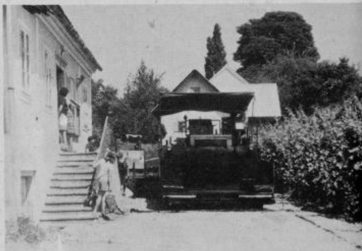
Kočijaž, ki pušča za seboj „črno sled“.

Kraj kot tak ni krenil nikamor. Razen elektrifikacije leta 1957 in regulacija Pesnice ni bilo ničesar takega, kar bi bilo omembe vredno. V takih razmerah nismo mogli ostati. Zato je politični aktiv sklical vse družbeno — politične organizacije in zastopnike ostalih organizacij. Tako je tudi pri KS — Desternik prišlo do nekaterih sprememb, ki so vidno vplivale na nadaljnji razvoj kraja. Ker prvi samoprisepek ni bil racionalno izkoriščen, smo uvedli še drugi samoprisepek. 50 % tega prispevka smo namenili za ureditev krajevnih cest in dograditev šole. Ostali denar smo namenili za modernizacijo občinske ceste. S soglasjem