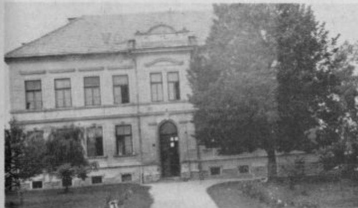
Dosedanji prostori v tej zgradbi niso učencem iz Laporja in okolice zagotavljali sodobnih oblik pouka.