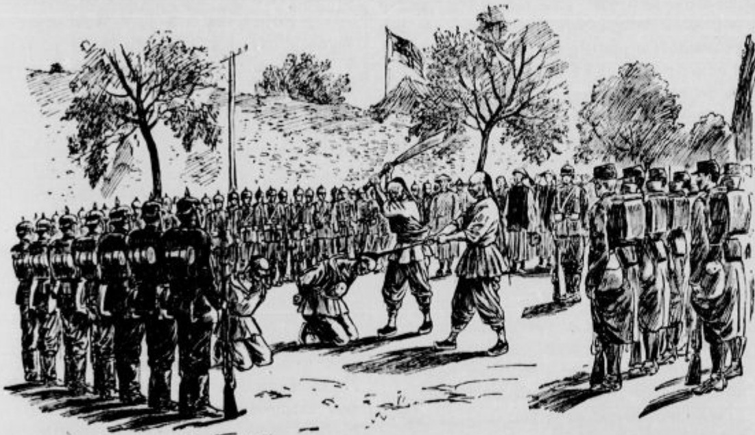
Kitajci obglavljajo morilca.

† Metliški semenj. Iz Novega mesta se nam piše: Čitali smo v cenjenemu „Domoljubu“, da je neki svečar iz Novega mesta na metliškem semnju, prodajal sveče, zavite v „Narod“. Podpisana izjavljava, da „Naroda“ ne čitava, ker odločno obsojava njegovo proticerkveno pisavo, torej tudi ne moreva