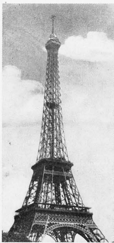
Simbol Pariza - Eifflov stolp, na katerega se bodo naši romarji lahko povzpeli med ogledovanjem francoske prestolnice

V Luxemburgu izhaja že 125 let »Luxemburger Worte«, ki je pisan največ v nemščini, deloma pa v francoščini in »luxemburščini«, ki je dialekt nemščine. Velja za katoliški list in je bil vedno v službi »resnice in pravice«. Izhaja v 78.000 izvodih.