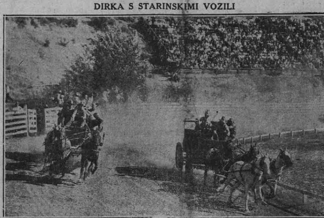
Veliko zanimanja so na letnem rodeo v Ellensburg, Wash., vzbudile dirke, ki so se vršile s starodavnimi vozovi, kakršni so bili edino prevozno sredstvo na zapadu v času, ko še ni bilo železnic. Gornja slika je bila vzeta sredi najbolj vroče tekme.

KAJ VSE "MAČEK" LAHKO POVZROČI Newport, Ky. — 53letni W. Earls se je po prečuti in prepiti noči počutil tako, kakor se pač vsakdo po taki noči počuti. Neznansko ga je zato razjarila ženinina zahteva, naj gre in popravi streho, ki pušča. Odločno je odklonil, da ne gre. Žena je nato napravila opazko, da bi go-