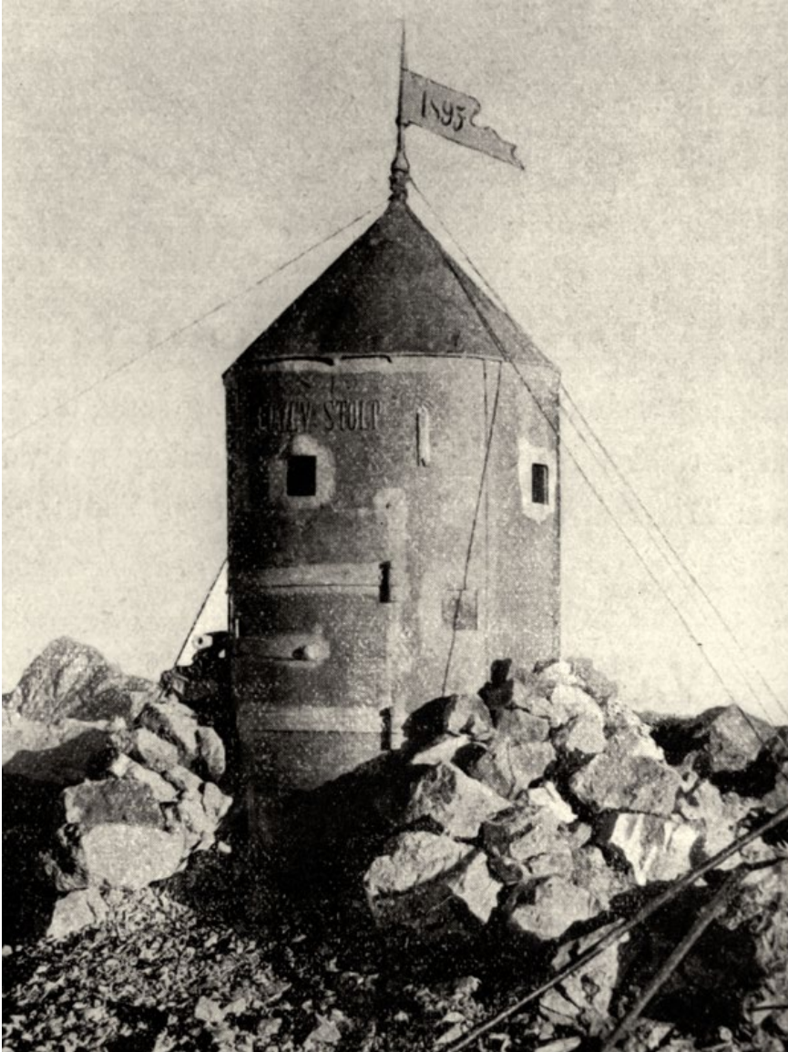
Stolp, postavljen leta 1895 vrh Triglava, je sprožil tožbo Nemcev proti Jakobu Aljažu.

z nemškimi organizacijami, ki so se ga lotile s trditvijo, da je ob izgradnji uničil podzemno triangulacijsko točko prvega reda. Z obtožbami so želeli doseči podrtje stolpa.