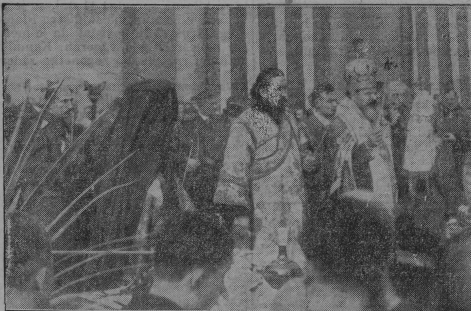
Proslava 50letnice prve bolgarske divizije.