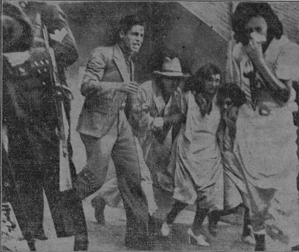
V Mehiki divja najljutejši kulturni boj. Na sliki vidimo, kako razganja policija katoliške demonstrante z bombami za solzenje. Katoliki protestirajo proti novemu brezverskemu šolskemu zakonu.