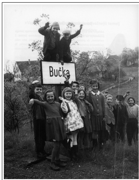
Sonce sredi Bučke, str. 10

V šolskem letu 1978/79 je prišlo do nove organizacije pouka na podružničnih šolah Studenec in Bučka zaradi zmanjševanja števila otrok. Učenci 1. in 3. razreda so obiskovali