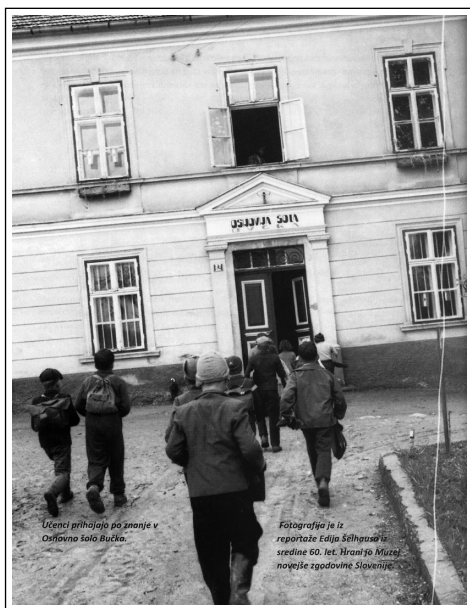
Učenci prihajajo po znanje v OŠ Sava Kladnika Bučka.

V zadnjem desetletju je število otrok z dobrih dvajsetih naraslo na