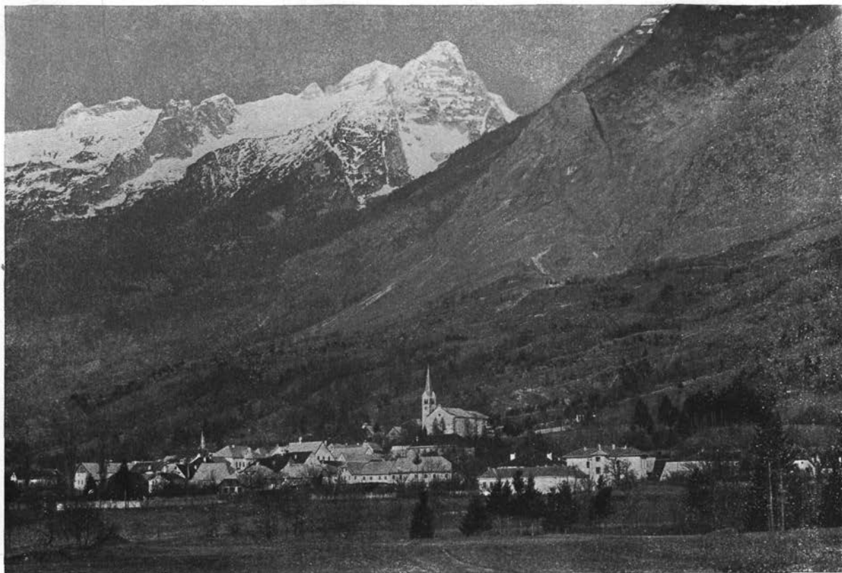
Bovec s Prestreljenikom.