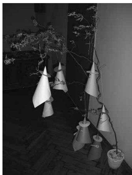
Slika 4: Preproste prijazne čarovnice

Noč čarovnic pa nikakor ne more miniti brez čarovnic. Čarovnice učencem še vedno predstavljajo zlobno bitje, ki ga poznajo iz pravljic. Mi pa smo se tokrat lotili izdelovanja preprostih in prijaznih čarovnic. Obesili smo jih na metlo in na vejo vrbe (slika 4).