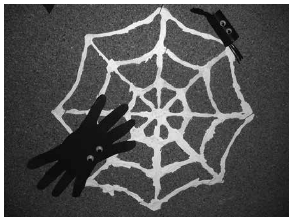
Slika 3: Pajek v obliki otroške dlani

lista papirja, škarij in spretnih otroških rok so nastale papirnate pajkove mreže (slika 1). Izdelovanja pajkovih mrež smo se lotili tudi z nekaterimi učenci iz četrtega in petega razreda. Postopek izdelovanja mreže za te učence je bil zahtevnejši. Za njeno izdelavo so bile potrebne velika natančnost, potrpežljivost in vztrajnost. Na bel list papirja smo narisali pajkovo mrežo, jo nalepili na karton in prekriili s prozorno vrečko. Nato smo z lepilom Mekol natančno naredili nitke mreže. Počakali smo nekaj dni, da se je lepilo posušilo, nato pa smo ga pobarvali z belo tempera barvo. Mrežo smo previdno oddvojili od njene podlage in jo ponosno pokazali sošolcem (slika 2). V drugem tednu smo ugotovili, da pajkova mreža brez pajka ni prava mreža. Učenci prvega razreda so pajka izdelali iz črnega šelešamerja v obliki rollice, učenci drugega razreda pa so ga naredili v obliki njihove dlani. Za nagajivejši izraz smo mu prilepili še premikajoče se oči (slika 3).