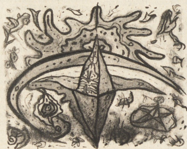
KLAVDIJ TUTTA: Dva dneva enega sonca, 1989, litografija in kombinirana tehnika. Delo je prejelo Nagrado Novega mesta.