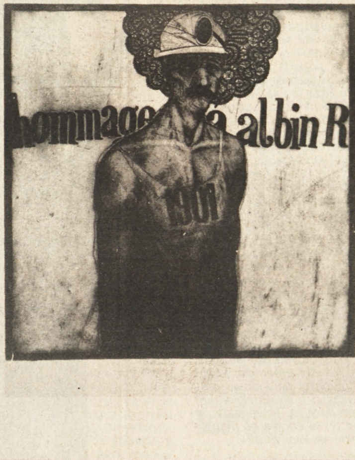
RUDI SKOČIR: Hommage a' la generation 1903, 1989, jedkanica in akvatinta. Delo je prejelo Nagrado Novega mesta.