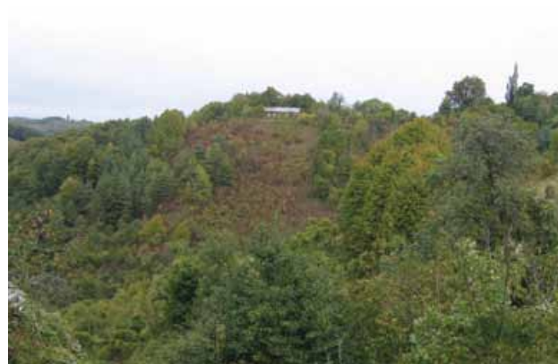
Slika 2: Zaraščanje kmetijskih zemljišč v Halozah.

Spreminjanje rabe zemljišč in celo opuščanje pridelave napovedujejo tudi podatki o velikostni sestavi kmetij, parcelni razdrobljenosti in starostni sestavi lastnikov. Leta 2007 je bilo v Halozah 57 % kmetij manjših od 5 ha (9), ob popisu kmetijskih gospodarstev leta 2000 celo 68 % (6). V odročnih in slemen-skih naseljih se hitro spreminjata socialna in starostna sestava gospodinjstev. Leta 2010 je bilo v naseljih Gorca in Slatina 46 % prebivalstveno neperspektivnih gospodinjstev, med katera uvrščamo ostarela in starejša gospodinjstva ter gospodinjstva s starejšo