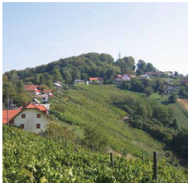
Slika 1: Drobnost lastništva vinogradov na Velikem Vrhu.

Skladno s slovensko in evropsko kmetijsko zakonodajo so Haloze uvrščene v skupino hribovskih in gorskih območij, kjer je zaradi precejšnje nadmorske višine in strmine površja raba zemljišč močno omejena ter se uporablja dražja, specializirana mehanizacija. Na podlagi te razporeditve so kmetije na območjih z omejitvenimi dejavniki upravičene do višjih subvencij za obdelavo in drugih ukrepov kmetijske politike. Neposredna plačila sicer preprečujejo zaraščanje in spreminjanje rabe zemljišč ter prispevajo k izboljšanju gospodarnosti pridelave, vendar v haloškem kmetijstvu temeljnih razvojnih problemov dolgoročno ne rešujejo.