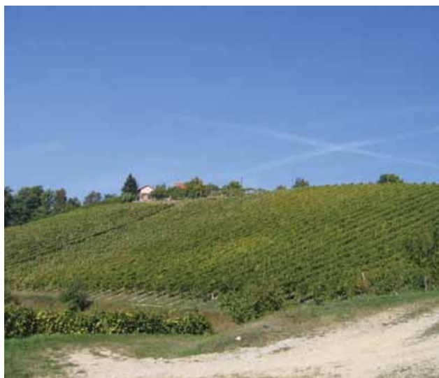
Slika 5: Novi vinogradi na Goričaku pri Zavrču. (foto: Vladimir Korošec).

Ker je kmetijstvo kompleksna dejavnost, zahtevajo razvojni ukrepi interdisciplinarni pristop, usklajevanje med različnimi dejavniki in dejavnostmi na podeželju ter predvsem sodelovanje pri uresničevanju skupnih razvojnih ciljev. Uveljavljanje sprememb in novih idej v kmetijski pridelavi ter predelavi je povezano z velikimi finančnimi sredstvi, ki jih haloško kmetijstvo iz lastne akumulacije ne more zagotoviti. Za doseganje višje kakovosti in gospodarske učinkovitosti so nujna vlaganja v obnovo zastarelih vinogradov, predelavo grozdja in opremo vinskih kleti, izgradnjo hlevov za govedorejo ter obsežna vlaganja v različne dopolnilne dejavnosti. Velikopotezni in finančno zahtevni načrti so uresničljivi le s sistematičnim in načrtnim črpanjem sredstev iz evropskih skladov, predvsem pa s preišljenimi finančnimi in davčnimi ukrepi, ki spodbujajo razvojne investicije na različnih področjih.