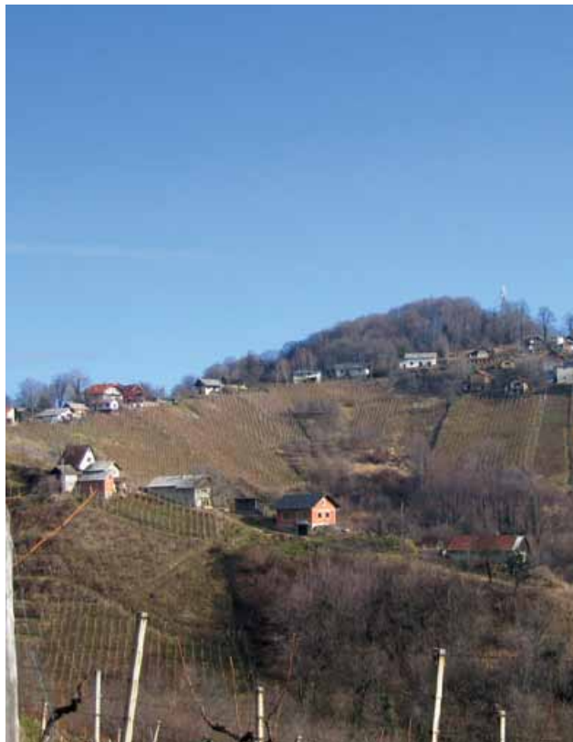
Slika 6: Najpomembnejša kmetijska dejavnost v Vinorodnih Halozah je vinogradništvo. To se izraža tudi v krajinski podobi pokrajine.

državni sklad, saj vsi najemniki niso razvili družinske tradicije vinogradništva. Vinogradniško in kmetijsko pridelavo bodo zmanjševali tudi lastniki počitniških bivališč in malih kmetij, ki imajo v lasti razmeroma