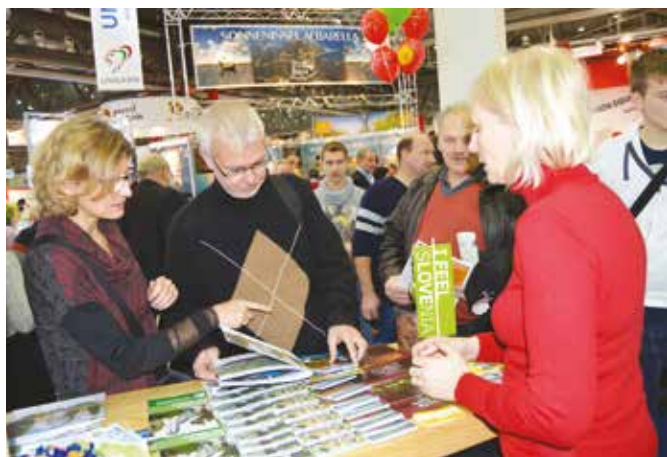
Avstrijski trg še vedno izjemno pomemben za moravskotopliški turizem

se predstavljali skupaj z Zvezdo turizem d.o.o. iz Murske Sobotice.