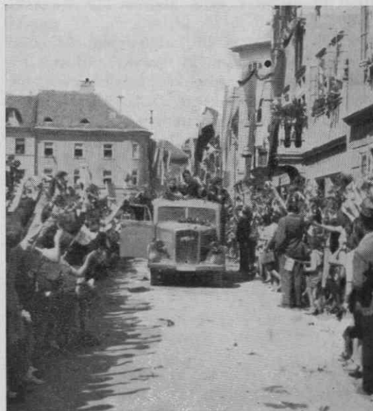
Osvoboditev Kranja 9. maja 1945

Pozimi in spomladi 1945 so bile politične razmere za protihitlerjevsko koalicijo zelo ugodne. Bila je še enotna in je na jaltški konferenci konec januarja naznanila bližnji začetek svoje poslednje ofenzive, ki naj privede do brezpogojne vdaje nemških oboroženih sil. Zanj so bile ugodne tudi vojaške razmere. Na vzhodni fronti je Rdeča armada pozimi osvobodila Poljsko in dosegla črto Odra—Slovaške planine—Estergom—Blatno jezero—Drava. Na zahodni fronti so zavezniki dosegli reko Reno in na njej napravili nekaj mostobranov z namenom, da najprej zavzamejo Porurje in nato napravijo splošno