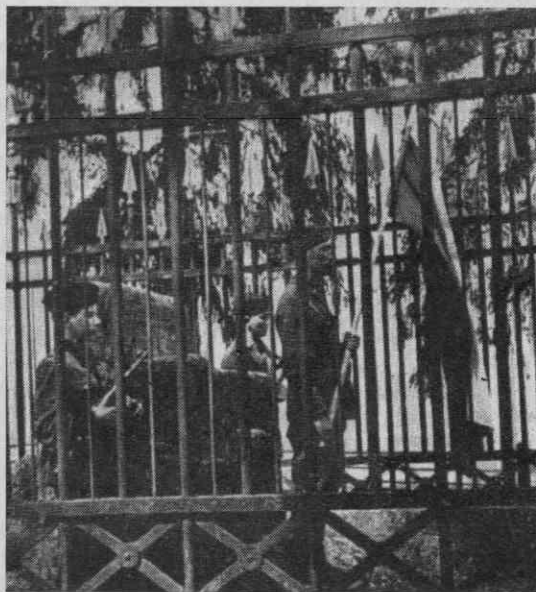
Jugoslovanska armada pri vojvodskem stolu na Gosposvetskem polju maja 1945

Ponoči od 8. na 9. maj je štab korpusa dal svojim divizijam povelje za prodor v Ljubljano: 15. divizija naj gre v smeri Lipoglav—Podmolnik—Sostro—Štepanja vas, kjer naj prekorači Ljubljanico in gre dalje proti železniški postaji ter Zeleni jami; 18. divizija naj gre proti Rudniku in Rakovniku ter dalje na Ljubljanski grad, od koder se naj spusti v središče mesta, kjer se bo združila z enotami 15. divizije; divizija Garibaldi, ki je že 20. aprila prišla v 7. korpus, pa naj še naprej ostane v rezervi.