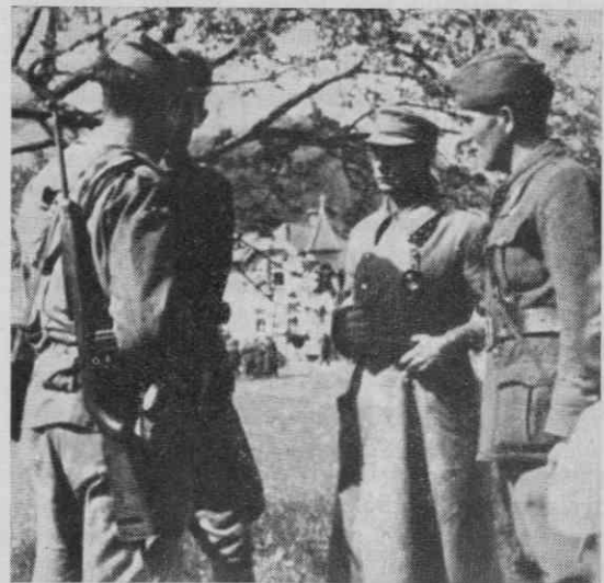
Löhrov štab na pogajanjih v Topolščici 10. maja 1945