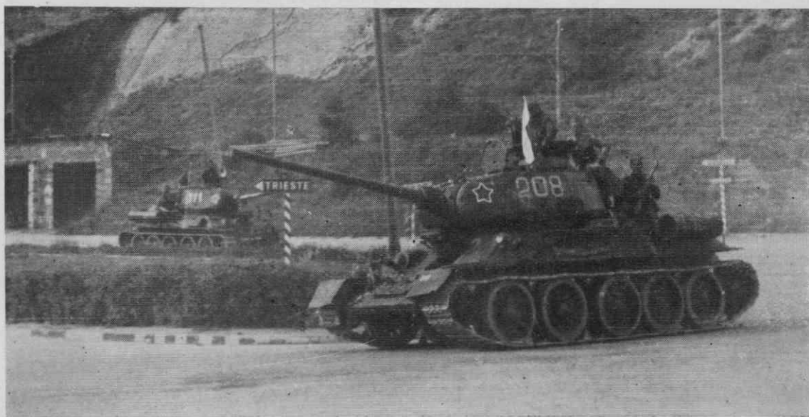
Tanki IV. armade prodirajo proti Trstu

15. korpus je 29. oktobra začel osvobajati Pelagonijo z napadom na Prilep, ki ga je osvobodil šele po tretjem napadu v noči na 2. november, čez dva dni je njegova 49. divizija osvobodila Bitolj, ker so se Nemci umaknili v Ohrid. Nemške sile, ki so se umaknile iz Prilepa in Bitolja, so se ustavile v Ohridu, da bi ga branile. Postal je pomemben za umik tistih enot, ki so zaradi napadov na Prilep in Bitolj morale zaviti proti Albaniji. Ohrid sta 7. novembra napadli 48. in 49. di-