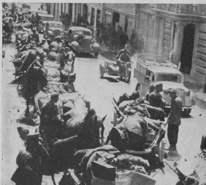
Nemška vojska na umiku skozi Tržič 9. maja 1945

Toda sovražnik je ustavil armado pred Klano. V prvi bitki 21. in 22. aprila 13. divizija ni mogla osvoboditi Klane in prebiti sovražne bojne črte. Zato je štab armade sklenil okrepiti krila in prodreti dalje proti Trstu. Toda to se ni dalo izvesti, ker sta krili (20. in 9. div.) preveč zaostali. Zato je od 25. do 27. aprila pred Klano divjala druga bitka. Že po drugem dnevu bitke je štab armade ukazal, naj enote pred Klano sovražnika le vežejo. Ko so do 26. aprila dozorili pogoji za napad na krilih — v smeri Mašun—Ilirska Bistrica in Opatija—Matulji, je ukazal, naj enote 27. aprila napravijo splošen napad na čelo in na krila in nato nadaljujejo prodiranje proti Trstu. Že prvi dan splošnega napada je prinesel znatne uspehe. Na desnem krilu je 20. divizija prebila črto Št. Peter—Prem—Knežak, na levem pa je 9. divizija, ki se je 24. in 25. aprila izkrcala pri Moščeniški Dragi, že prodirala v zaledje reške fronte. Zaradi nezmanjšane pritiska pred Klano sovražnik ni mogel oddvojiti sil za okrepitev in zavarovanje