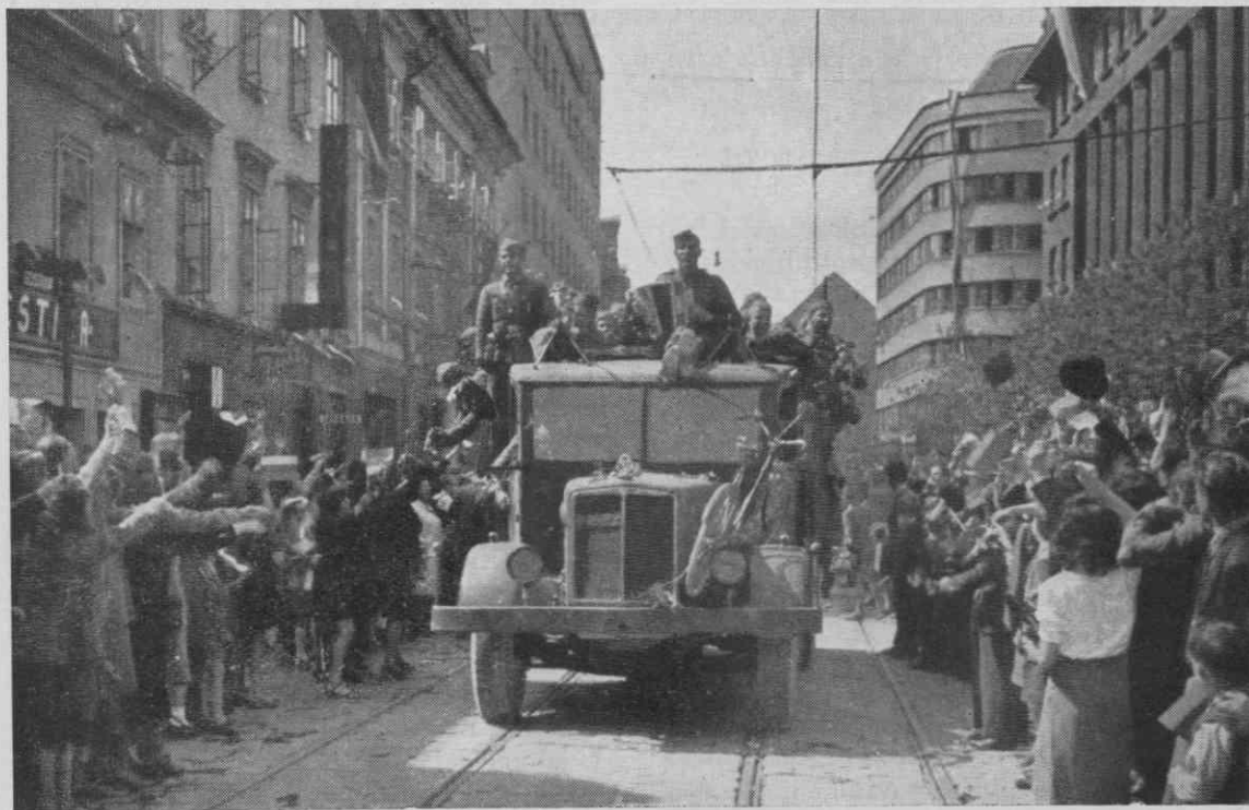
Osvoboditev Ljubljane 9. maja 1945

V severni Dalmaciji je bilo treba najprej osvoboditi Benkovac, ki je bil pomemben za nadaljevanje operacij v dveh smereh — proti zahodu (Velebitskemu Kanalu) in proti vzhodu (prometnim zvezam med severno Dalmacijo in Liko). Osvobodila ga je 19. divizija, ki je uspela šele v tretjem napadu 7. oktobra, 30. oktobra je osvobodila še Zadar. Nato je 26. divizija napadla in osvobodila Šibenik 3. novembra, ko so Nemci poto-