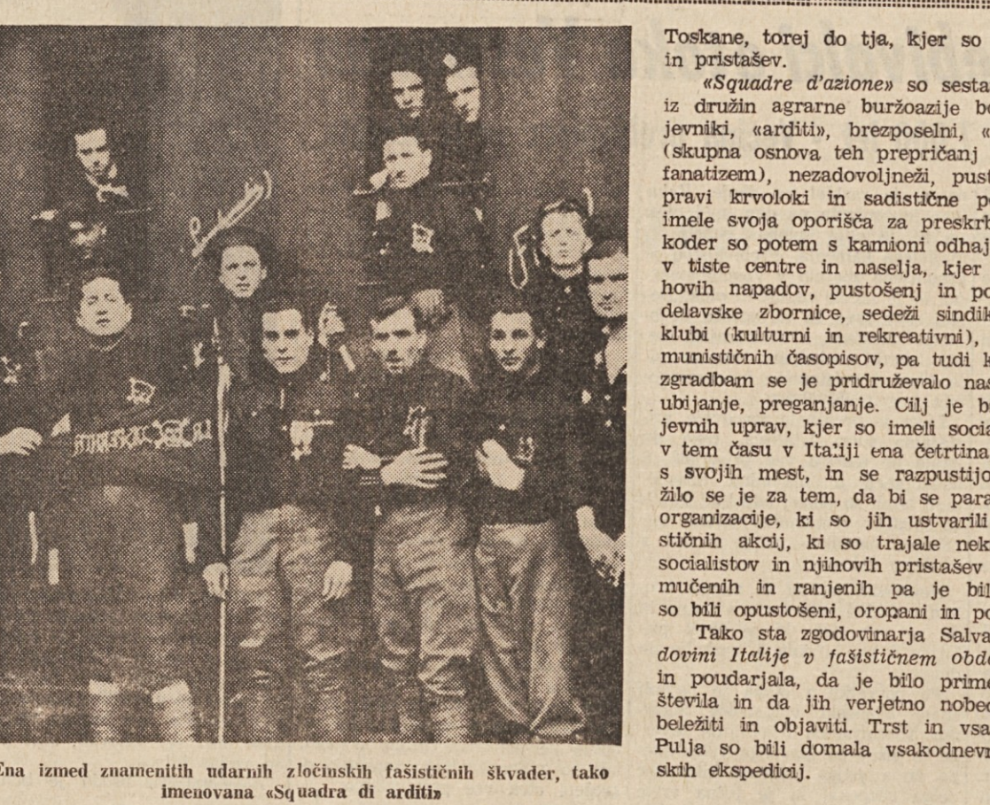
Ena izmed znamenitih tudašnih zločinskih fašističnih škvader, tako imenovana «Squadra di arditi»

Mussolinijevi «fasci di combattimento» so odlično služili v borbi proti delavskemu gibanju, za preprečevanje bodočih «rdečih nevarnosti» ter za «vzpostavitev reda in miru».