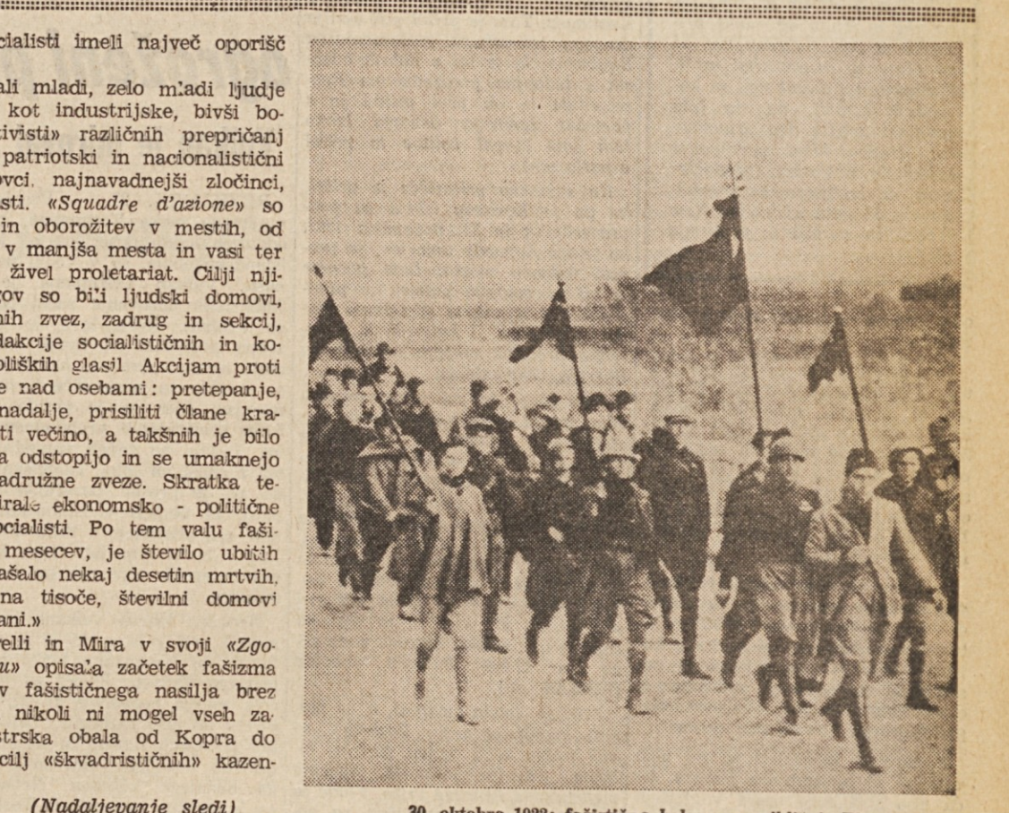
30. oktobra 1922: fašistična kolona se približuje Rimu (Nadaljevanje sledi)