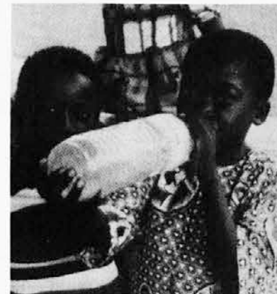
Voda je v deželah saharškega območja najbolj dragocena zemeljska prvina