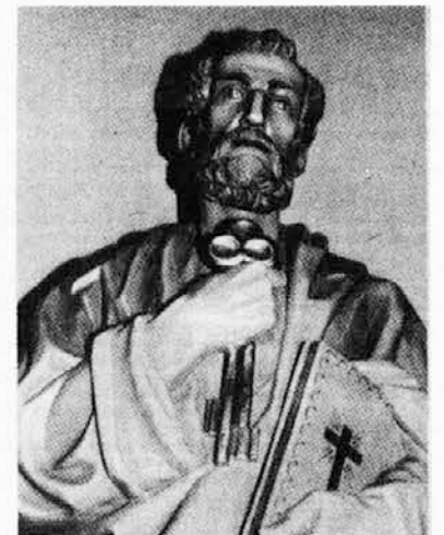
Kip sv. Petra apostola, izdelan v Grödnju (Val Gardena) na Južnem Tirolskem, ki ga je goriška škofija poklonila krščanskemu občestvu Nimbò Bouaké. Kip krasi sedaj novo zgrajeno prostorno cerkev, ki je posvečena prvaku apostolov