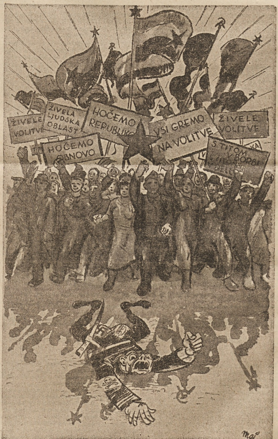
Zmudrajmo z volivami ostanek reakcije, ki še vedno brezupno kriči: »Volitve ne bo!«