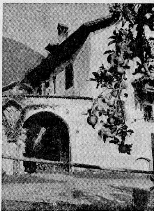
KMETSKA HIŠA NA PROSUŠENEM TERITORIJU.

In ko se proti večeru oglasi domači cerkveni zvon in vabi kmetje k premišljanju in molitvi, na tisoče rok se dvigne proti nebu v znak hvaležnosti »za vsakdanji kruh«.