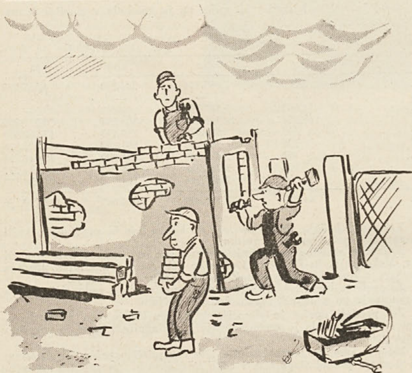
Renoviranje portirnice v teku

Izdaja Keramična industrija Liboje. Urejuje uredniški odbor. Odgovorni urednik Šuler Darko. Izhaja dvomesečno. Uredništvo: telefon Petrovče 1. Tisk ČP »Celjski tisk« Celje.