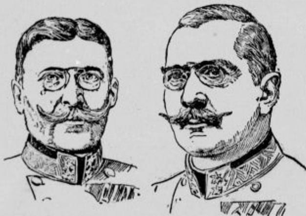
General vit. Auffenberg. — Fml. Dankl.

V velikih bojih, v katerih je bila poražena ruska armada v vzhodni Pru-