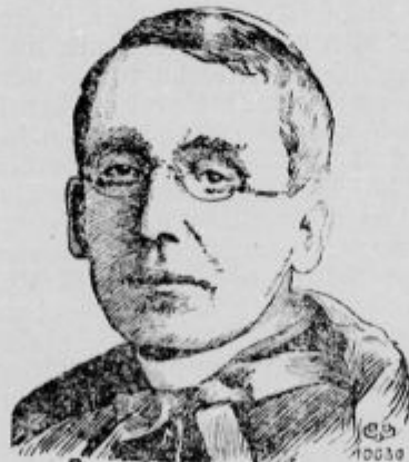
Sv. oče Benedikt XV.

jetnika, kakršnega nima vesoljni svet, poglavarja katoliške Cerkev. Vatikanski zidovi so ga sprejeli v se. Kako dolgo? Kako dolgo bo trajalo še to jetništvo poglavarja svete Cerkev? Ali ni čas, da bi sedaj, ko se bodo reševala svetovna vprašanja, rešilo tudi to vprašanje v korist in blagor svete Cerkev. Vroča želja katoliškega sveta je to! Katoliško ljudstvo v Evropi je poslalo sedaj svoje najboljše sinove v sveti boj za sveto stvar. Poglavar tega ljudstva,