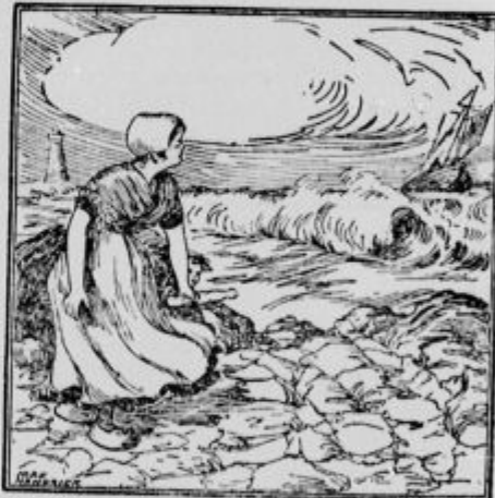
Kje je oče?

Naročite srečko »Rdečega križa«! Glavni dobitki po 60.000, 30.000 in 20.000 kron v gotovem denarju. Vsaka srečka zadene! — Pojasnila daje in naročila sprejema glasom današnjega oglasa: Srečkovno zastopstvo 12, Ljubljana.